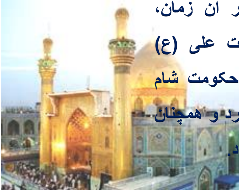
حرم حضرت علی (ع) شهر نجف

پس از مدتی همه ی سرزمین های اسلامی، به جز شام(سوریه)، پیرو حضرت علی (ع) شدند. در آن زمان، معاویه پسر ابوسفیان، حاکم شام بود. حضرت علی (ع) معاویه را که مردی فاسد و ستمگر بود، از حکومت شام برکنار کردند اما معاویه از این دستور سرپیچی کرد و همچنان در شام ماند و به مخالفت با امام علی (ع) ادامه داد.