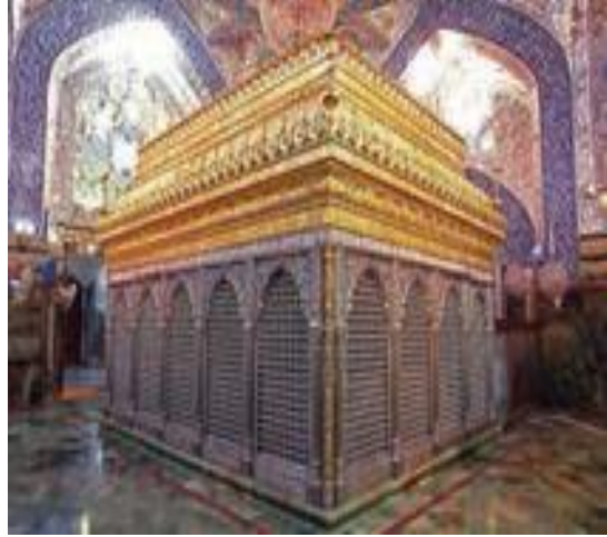
حرم حضرت علی (ع)

پس از شکست سخت خوارج در جنگ نهروان، یکی از آن‌ها مأمور کشتن حضرت علی (ع) شد. او که ابن ملجم نام داشت، در سحرگاه روز ۱۹ رمضان سال چهارم هجری، هنگامی که حضرت علی (ع) در مسجد کوفه مشغول خواندن نماز صبح بودند، با شمشیر زهرآلود خود ضربه‌ای به سر آن حضرت زد. حضرت علی (ع) دو روز بعد، در ۲۱ رمضان به شهادت رسیدند.