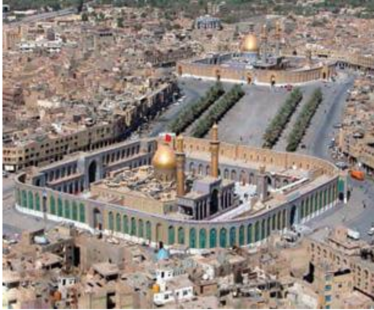
بین الحرمین کربلا، حرم امام حسین (ع) و حضرت ابوالفضل (ع)

سرانجام در روز دهم محرم (عاشورا) سال ۶۱ هجری، امام با یاران اندک ولی با ایمان خود در صحرای کربلا در برابر لشکر بی شمار دشمن ایستادند.