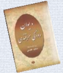
رودکی، پدر شعر فارسی