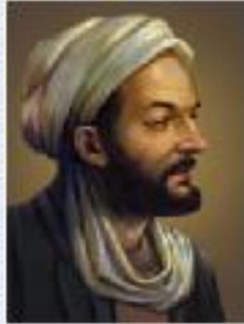
ابوعلی سینا فیلسوف و پزشک ایرانی