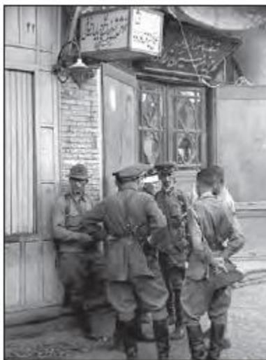
نیروهای انگلیسی در ایران-جنگ جهانی دوم نظامیان شوروی در ایران- قزوین-جنگ جهانی دوم

۵. تصویر مقابل به موقعیت ایران در جنگ جهانی دوم اشاره دارد. با توجه به اینکه ایران در جنگ جهانی دوم اعلام بیطرفی نمود دلایل حضور این نیروها در ایران را بررسی و ارزیابی نمایید.