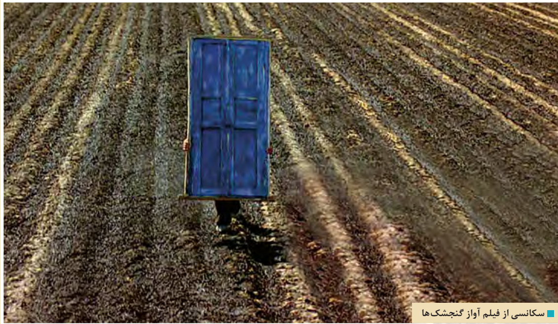
■ سکانسی از فیلم آواز گنجشک‌ها