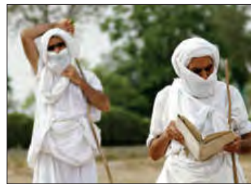
■ مراسم عروسی مندائیان در اهواز