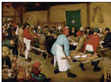
■ عروسی روستاییان اثر پیتربروگل

لازمهٔ شناخت پدیده‌های اجتماعی، شناخت صحیح و توأمان «تفاوت‌های فردی - اجتماعی» و «وجه مشترک» انسان‌هاست.