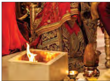
■ مراسم عروسی در هندوستان