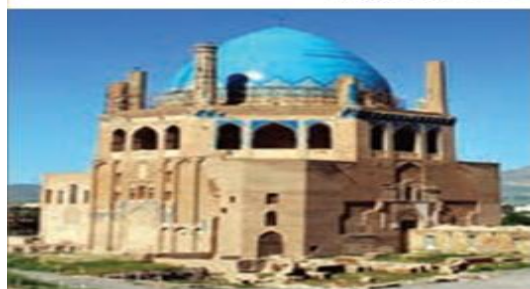
کبکد سلطنتیه بزرگ ترین کتبد خشتی جهان در زنجان