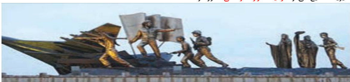
اقوام‌زبان و پیروان مذاهب مختلف در صحنه دفاع مقدس

تنوع فرهنگی، ظرفیت‌های بالای انسانی و سرمایه‌های فراوان فکری و معنوی را برای کشور به وجود می‌آورد که در صورت هوشیاری و مدیریت صحیح، می‌تواند زمینه‌ساز رشد و تعالی کشور شود.