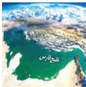
خلیج فارس نماد جاودانگی ایرانیان

۱۶- چه عواملی از ایران، کشوری با جایگاه ویژه و مقتدر در منطقه ساخته است؟