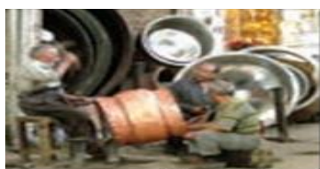
سحس‌گری در اصفهان

شکل‌های مختلف زندگی شهری، روستایی، عشایری و تفاوت در شرایط اقتصادی و اجتماعی رابه وجود آورده است. براساس تفاوت سطح درآمدها و شرایط مادی، به طور طبیعی، طبقات اقتصادی و اجتماعی متفاوت شکل گرفت و نمادها، الگوها و ارزش‌های گوناگون و سبک‌های زندگی و فرهنگ‌های متنوع، پدیدار شده است.