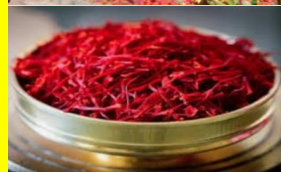
زرشک و زعفران ایران

دلایل شکل گیری تجارت و مبادله بین کشورها