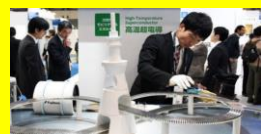
فناوری در ژاپن