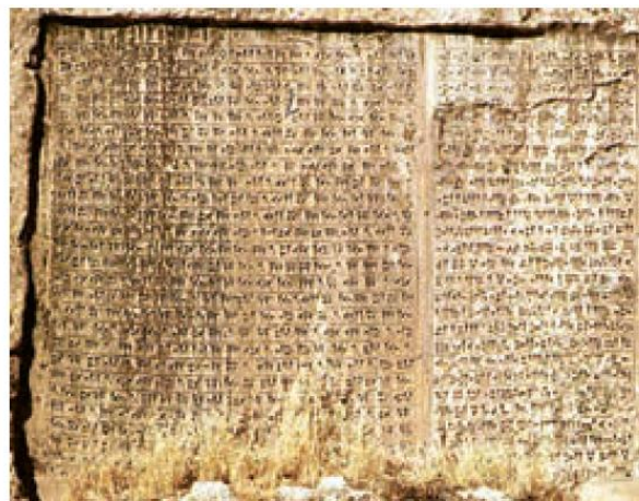
کتیبه به خط میخی

کتیبه های به جا مانده از دوره هخامنشیان در بیستون و تخت جمشید به زبان پارسی باستان و با خط میخی نوشته شده است. در دوره های اشکانیان و ساسانیان، خط پهلوی رایج بود.