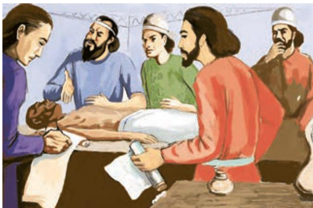
یک نقاشی از حضور پزشکان بر بالین یک بیمار در دانشگاه جندی شاپور

در دوره ساسانیان، شاپور ساسانی در شهر (جندی شاپور) در خوزستان کنونی مدرسه های پزشکی و بیمارستانی تأسیس نمود که یکی از قدیم ترین مدارس پزشکی جهان به شمار می روند. او از دانشمندان و استادان برجسته دیگر کشورهای آن روز نیز برای تدریس در این دانشگاه دعوت می کرد. در این مدرسه بزرگ علاوه بر پزشکی، نجوم، ریاضیات، موسیقی، شیمی (کیمیاگری) و... تدریس می شد.