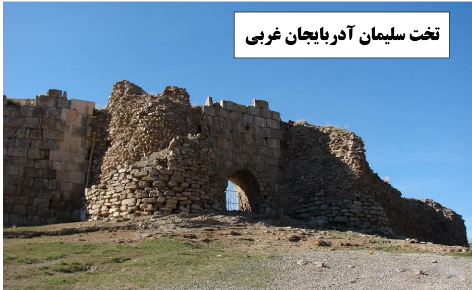
تخت سلیمان آذربایجان غربی