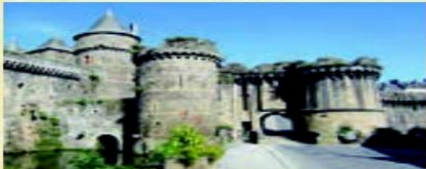
○ قلعه‌ای به جا مانده از فئودال‌ها - فرانسه

در قرون وسطا، بیشتر جمعیت اروپا را روستائینان تشکیل می‌دادند و مالکیت زمین‌های کشاورزی در دست زمینداران بزرگ بود که به آنها فئودال می‌گفتند. اربابان