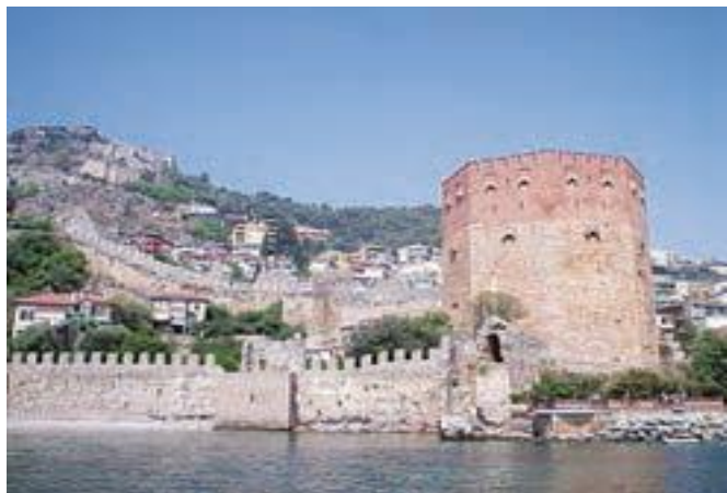
برج سرخ از آثار دوره سلجوقیان در شهر آنالیا، ترکیه