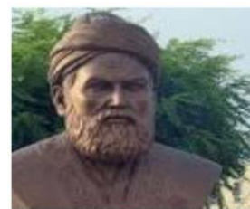
حمد الله مستوفی