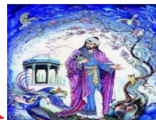
حافظ (ویژگی ها):