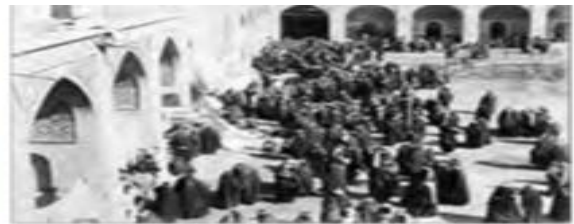
■ حضور فعال مردم در جنبش تنباکو به تبعیت از علما

۹- برخورد رقابت آمیز عالمان دینی با قاجار، چگونه بود؟