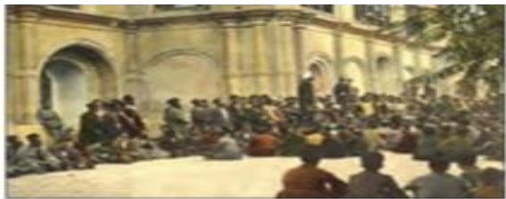
■ نمایندگان دوره های نخست مجلس شورای ملی

منظور از فعالیت های رقابت آمیز، ورود فعال به عرصه زندگی اجتماعی و سیاسی، نه در جهت تایید قدرت حاکم و حمایت از آن بلکه در رقابت با آن است .