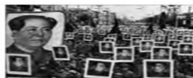
انقلاب های کوبا، الجزایر، هند و چین