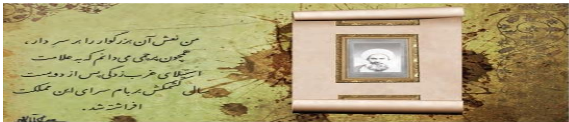
جمله‌ای از جلال آل احمد درباره شهید شیخ فضل الله نوری

منظور عالمان مسلمان از مشروطه، مشروط کردن حاکمیت به احکام عادلانه الهی بود اما منظور منورالفکران از مشروطه نوعی حاکمیت سکولار مانند دولت انگلستان بود.