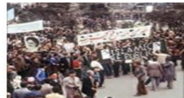
انقلاب اسلامی ایران تنها یک انقلاب سیاسی نبود و تمامی اتسان ها را مخاطب خود قرار می داد.