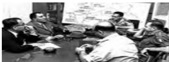
دیدار ارتشبد طوفاتیان معاون وزیر جنگ حکومت پهلوی با موشه دایان وزیر اسرائیل، برای همکاری مشترک نظامی

پس از گذشت بیش از هفتاد سال از انقلاب مشروطه و نیم قرن از حاکمیت پهلوی، انقلاب اسلامی ایران رخ داد. امام خمینی (ره) انقلاب را هنگامی آغاز کرد که شاه در حاشیه دولت های غربی در جایگاهی امن قرار گرفته بود و ماموریت حفظ امنیت منطقه را برعهده داشت. روشنفکران چپ نیز از صحنه رقابت های سیاسی داخلی کشور حذف شده بود.