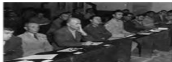
دادگاه سران حزب توده، این حزب از سازمان یافته ترین گروه های سیاسی چپ و مخالف شاه بود که با سرکوب گسترده از سوی حکومت پهلوی روبه رو شد.