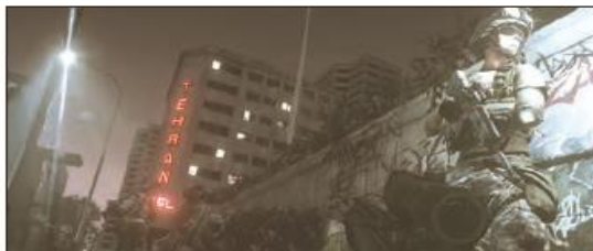
■ استفاده از ابزار رسانه ای در قالب بازی های رایانه ای؛ بازی رایانه ای که در آن حمله به ایران و مناطقی از تهران شبیه سازی شده است.