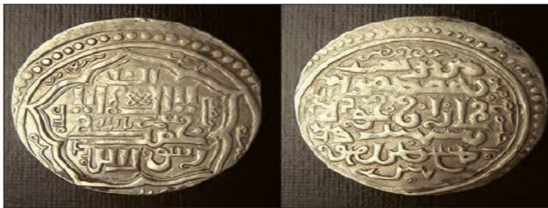
■ به دستور غازان خان شهادتین (لا اله الا الله، محمد رسول الله) بر دو سوی سکه ها ضرب شد.