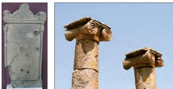
■ بنا و سنگ نوشته‌ای به خط یونانی به جا مانده از سلوکیان. حضور نظامی سلوکیان در ایران منجر به بسط فرهنگی آنان نشد.

- ایرانیان و یونانیان باستان فتوحاتی فراتر از مرزهای جغرافیایی شان داشتند اما جهان گشایی ها به جهانی شدن فرهنگ آنان منجر نشد.