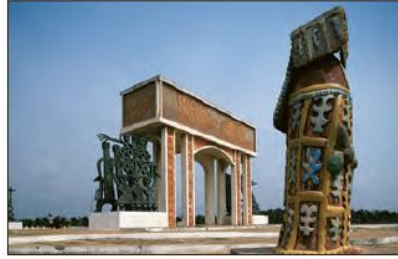
■ بنای یادبود تجارت برده و تندیس‌های به کار رفته در آن در امتداد جاده بردگان در غرب کشور بنین در قاره آفریقا؛ این بنا یادآور آفریقایی‌هایی است که در قرون ۱۶ تا ۱۹ میلادی ربوده و به غرب فروخته شدند.