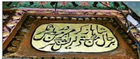
■ زبان فارسی پیش از آنکه هندوستان مستعمره انگلستان شود، دومین زبان رسمی و زبان فرهنگی و علمی این کشور بود. در سال ۱۸۲۶م، انگلیسی ها، زبان انگلیسی را زبان رسمی هند کردند.