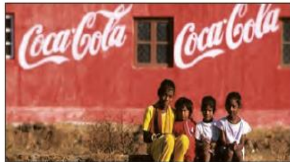
■ تبلیغات شرکت‌های تجاری در هند و نیجریه