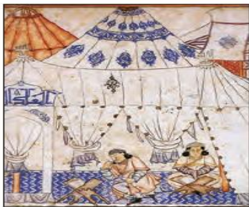
■ غازان خان در حال قرائت قرآن. او هفتمین ایلخان از سلسله ایلخانان ایران بود که به اسلام روی آورد و اسلام را دین رسمی اعلام کرد.

- مغولان نیز با قدرت نظامی خود مناطق وسیعی از جهان را تصرف کردند ولی فرهنگ آنها، قومی و قبیله ای بود و شایستگی های جهانی شدن را نداشت. آنان به سرعت تحت تأثیر فرهنگ هایی قرار می گرفتند که به لحاظ نظامی از آنان شکست خورده بودند. این گونه بود که امپراتوری مغول در چین، هند و ایران تحت تأثیر فرهنگ های اقوام مغلوب، هویتی چینی، هندی و ایرانی پیدا کرد و به صورت سه حکومت مستقل درآمد.