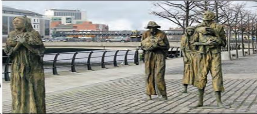
■ یادمان قربانیان قحطی بزرگ در دوبلین پایتخت ایرلند