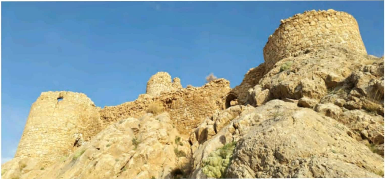
بقایای شیر قلعه شهسپرزاد - استان سمنان

در سال های اخیر دانش باستان شناسی با بهره گیری از ابزارها و روش های مدرن، پیشرفت زیادی کرده است و نتایج تحقیقات آن علم، معیاری مناسب برای سنجش اعتبار اخبار تاریخی محسوب