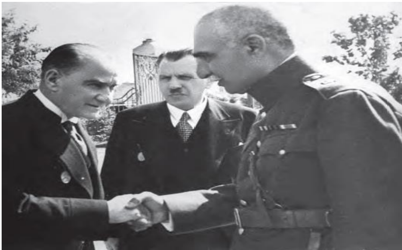
رضاشاه و آتاتورک