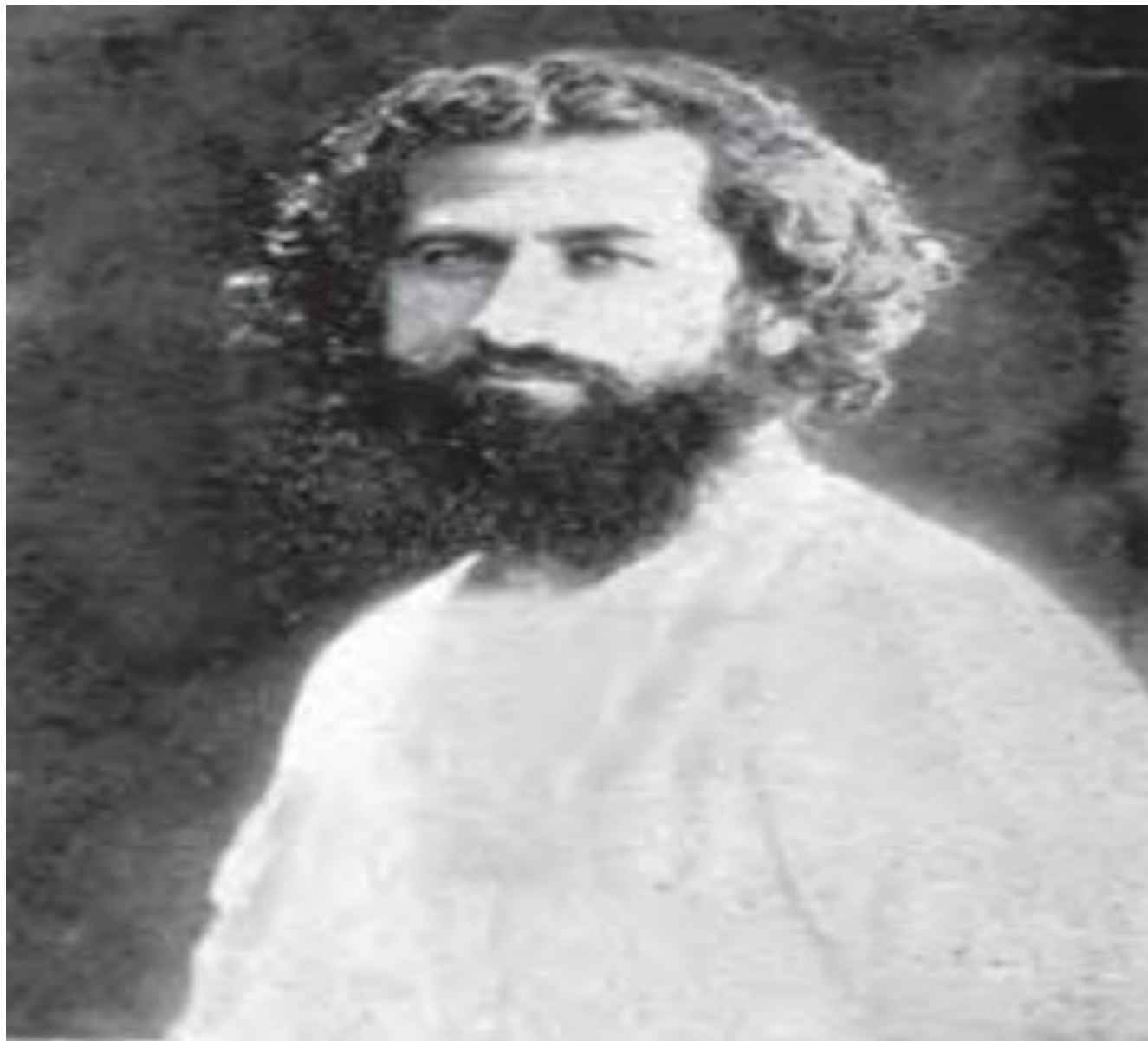
میرزا کوچک خان