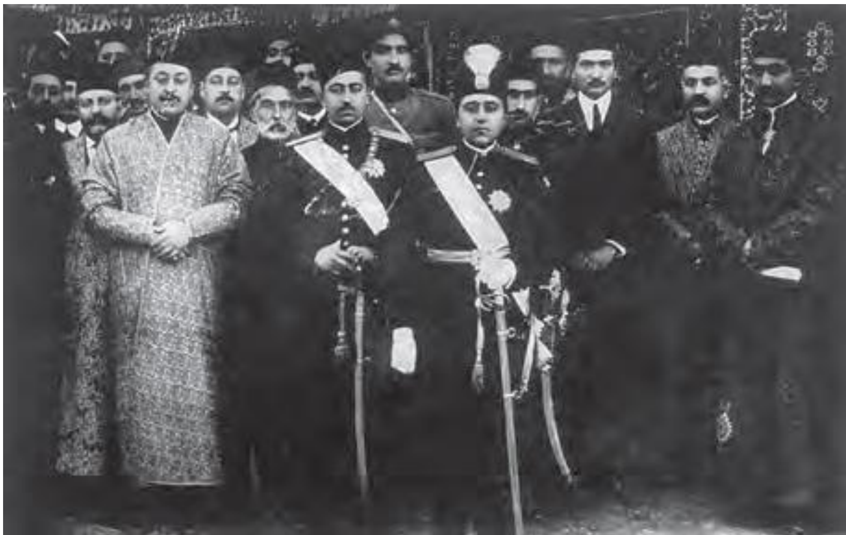
احمد شاه قاجار به همراه رضاخان و رجال درباری