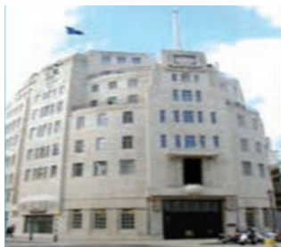
ساختمان مرکزی خبررسانی بی بی سی در لندن

خبرگزاری های آسوشیتدپرس، یونایتدپرس، رویتر، فرانسوپرس و یتارتاس.