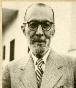
سید اشرف الدین گیلانی