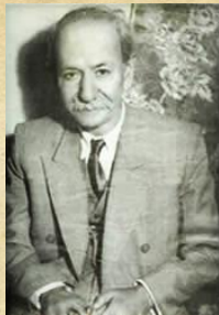
ملك الشعراى بهار