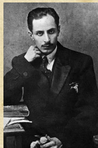
ادیب الممالک فراهانی