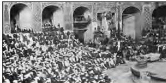
■ تکیه دولت؛ بنایی که برای برگزاری مراسم محرم و صفر و اجرای تعزیه به فرمان ناصرالدین شاه در تهران برپا شد.