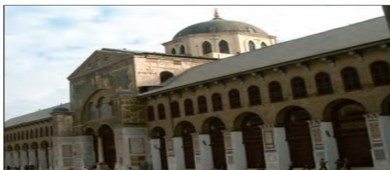
■ مسجد اموی در دمشق