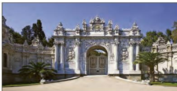
■ کاخ دلمه باغچه در استانبول، در بنای این کاخ که محل اقامت آخرین سلاطین عثمانی بوده، ۱۴ تن ورقه طلا به کار رفته است.