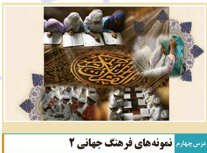
درس چهارم نمونه های فرهنگ جهانی ۲

- دانش آموزان گرامی به تصویر عنوانی درس نگاه کنید و بنویسید چه نمونه هایی از فرهنگ جهانی در آن می بینید؟