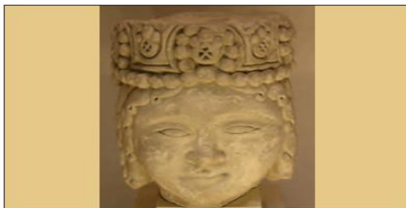
■ سردیس شاهزاده سلجوقی، مهم ترین پوشش سر پادشاهان سلجوقی و غزنوی تاج با تزییناتی از جواهرات بود.