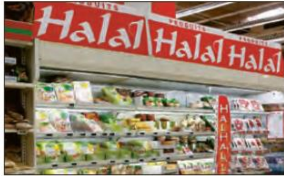
■ گسترش اسلام در کشورهای غربی