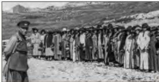
■ به دنبال تصویب قانونی در ۱۷ دی ۱۳۱۴ هـ.ش، استفاده از چادر، روبنده و روسری برای زنان و دختران ایرانی ممنوع شد.