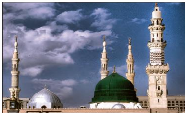
■ مسجد النبی در مدینه