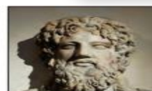
چند تن از خداوندگاران یونان و روم باستان: زئوس، ژوپیتر، نیتون، هرمس