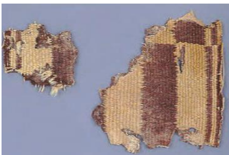
قطعه هایی از بقایای پارچه های پشمی به جا مانده از ساسانیان-موزه متروپولیتن نیویورک

نکته: قالی بهارستان که اعراب مسلمان از کاخ تیسفون به غنیمت گرفتند، شهرت بسیار دارد.