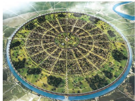
نمونه بازسازی شده تصویر سمت چپ