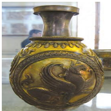
ظروف فلزی دوره