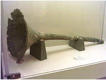
کَرنَا، یکی از سازهای موسیقی به جا مانده از دوره باستان

دوره ساسانی یکی از دوران های درخشان موسیقی ایران است. هنرمندان در دوره ساسانی، بیش از پیش مورد توجه شاهان قرار گرفتند و از منزلت و امتیازات ویژه برخوردار شدند. از خوانندگان و نوازندگان آن دوره با عنوان گوسان، خنیاگر و رامشگر یاد شده است.