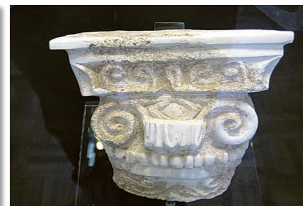
تزیینات معماری دوره اشکانی اشکانی