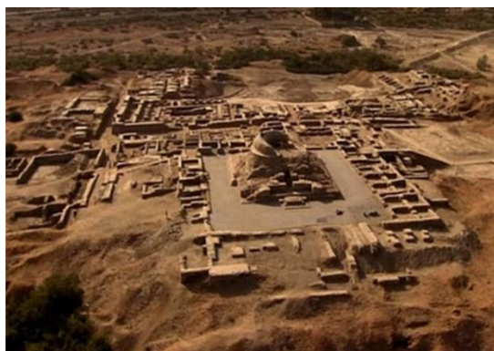
بقایای شهر هاراپا