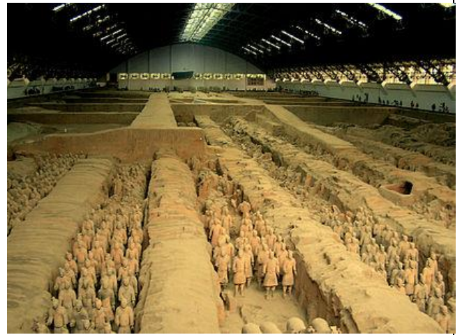
آرامگاه شی هوانگ تی

نمونه سوالات مکمل درس برای درک بهتر مطالب مطرح شده در درس