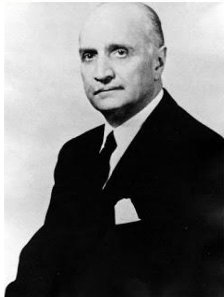
لوئی هندرسون سفیر آمریکا

لویی هندرسن سفیر آمریکا که نقش مهمی در روزهای حساس کودتای ۲۸ مرداد ۳۲ برعهده داشت، او به دکتر مصدق تکلیف کرد که از پست خود کناره گیری کند ولی دکتر مصدق با عتاب او را از خانه اش بیرون کرد.