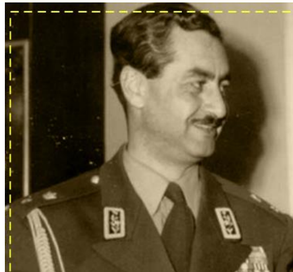
سرتیپ تیمور بختیار

تیمور بختیار که افسری بی رحم و خون ریز بود، برای استقرار و تثبیت حکومت کودتا، سرکوب نیروهای ضدکودتا و میهن دوست را آغاز کرد.