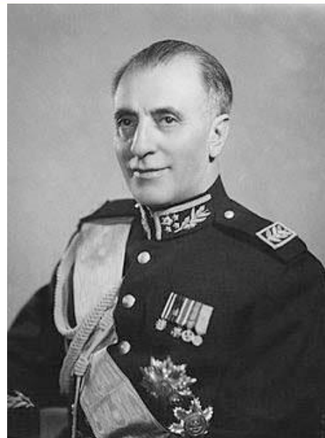
فضل الله زاهدی

با روی کار آمدن دولت نظامی فضل الله زاهدی ، فضای تیره ای در جامعه ایران حکم فرما شد.