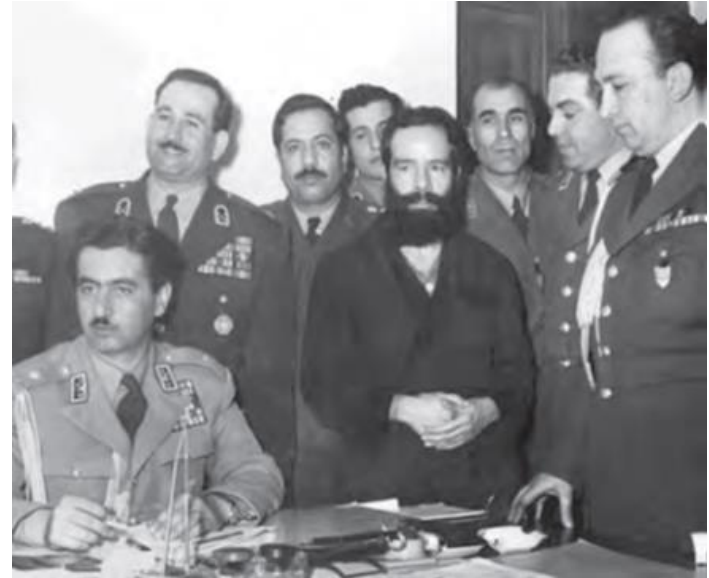
دستگیری دکتر فاطمی وزیر خارجه دکتر مصدق

تظاهرات شهرستان‌ها و تهران با سرکوب شدید مواجه شد؛ فرمانداری نظامی، همچنین سقف بازار تهران را تخریب و جمعی از بازاریان را به جزیره خارک تبعید کرد.