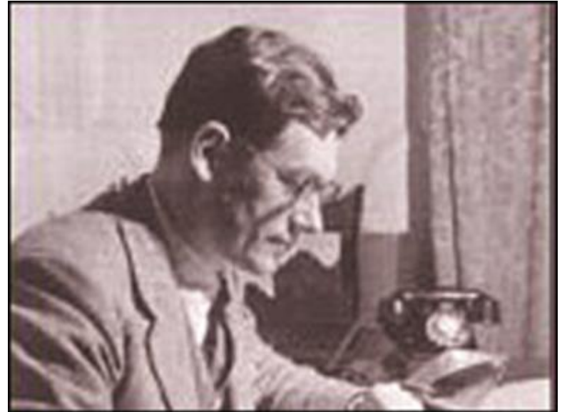
سر دنیس رایت

سر دنیس رایت کاردار انگلیس وارد تهران شد و دو دولت ایران و انگلیس طی اعلامیه‌ای برقراری روابط سیاسی را اعلام کردند. در پی آن آیت الله کاشانی با این اقدام دولت زاهدی مخالفت کرد.