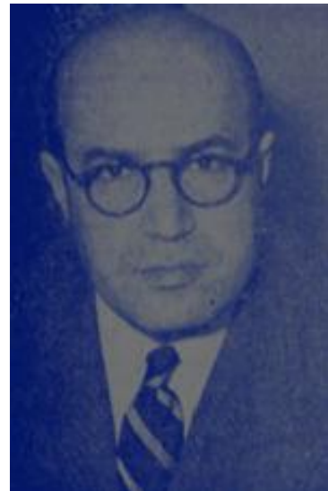
جعفر شریف امامی

انتخاب شریف امامی در واقع حاصل توافق شاه و انگلستان با استفاده از فرصت انتخابات ریاست جمهوری آمریکا بود. با وجود این، کندی رئیس جمهوری آمریکا به شاه و شریف امامی اعتماد نداشت و آن ها را برای اجرای برنامه هایش در ایران مناسب ندید.