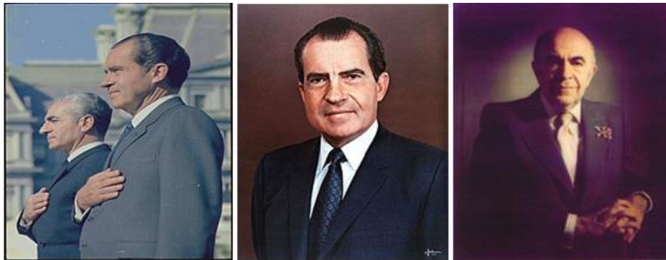
ریچارد نیکسون و محمدرضا پهلوی

❖ شاه همچنین با شوروی که رقیب و دشمن آمریکا بود، مناسبات سیاسی نسبتاً دوستانه‌ای داشت و به رغم سلطه آمریکا بر ایران، روابط حکومت پهلوی با شوروی سرد و خصومت‌آمیز نبود.