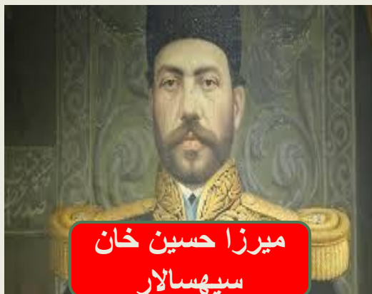
میرزا حسین خان سپهسالار