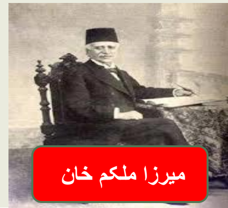
میرزا ملکم خان