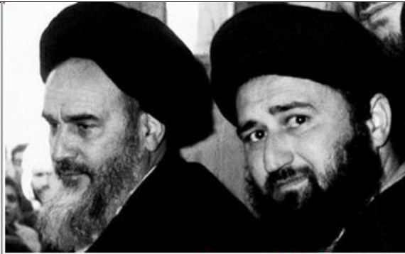
آیت الله سیدمصطفی خمینی