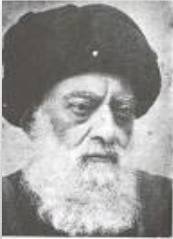
آیت الله سید محمد طباطبائی