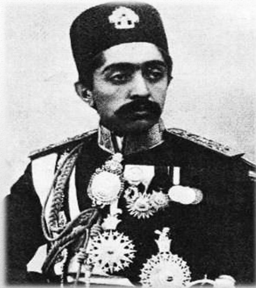
شعاع السلطنه، حاكم فارس