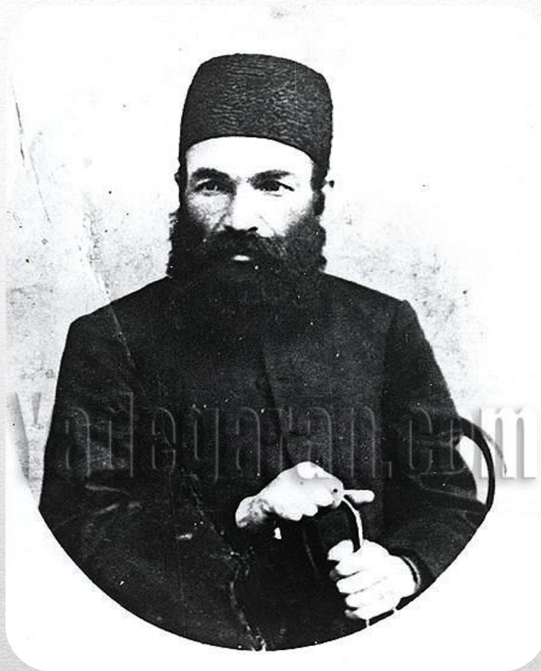
آصف الدوله، حاكم خراسان