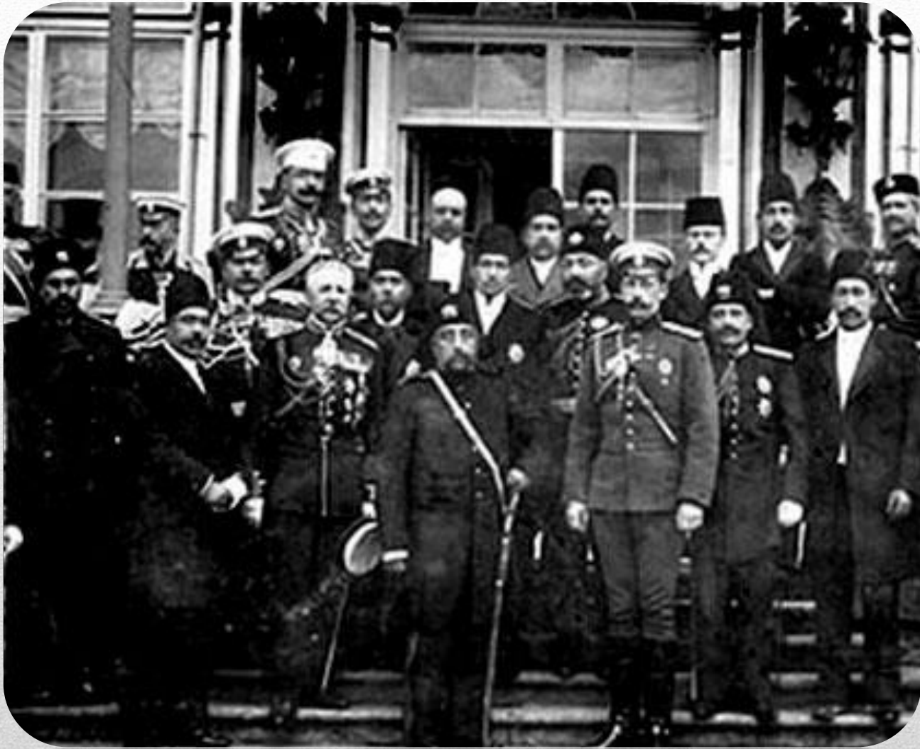
سفر ناصرالدين شاه به فرنگ