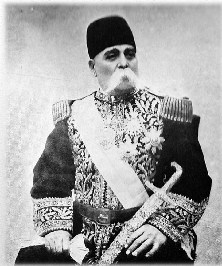
صدراعظم مظفرالدين شاه، عين الدوله