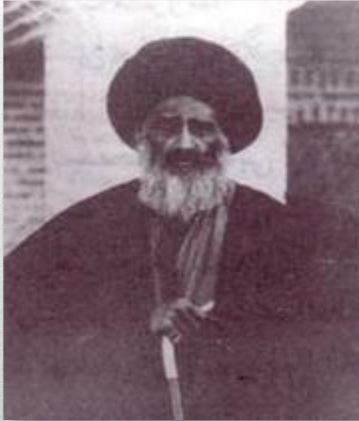
آیت اللہ سید عبداللہ بہبہانی