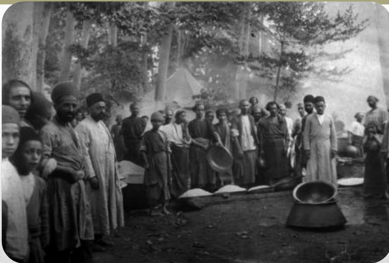
متحصین در سفارت انگلستان