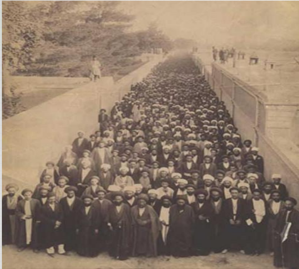
مشروطه خواهان در کنار دیوار سفارت انگلیس