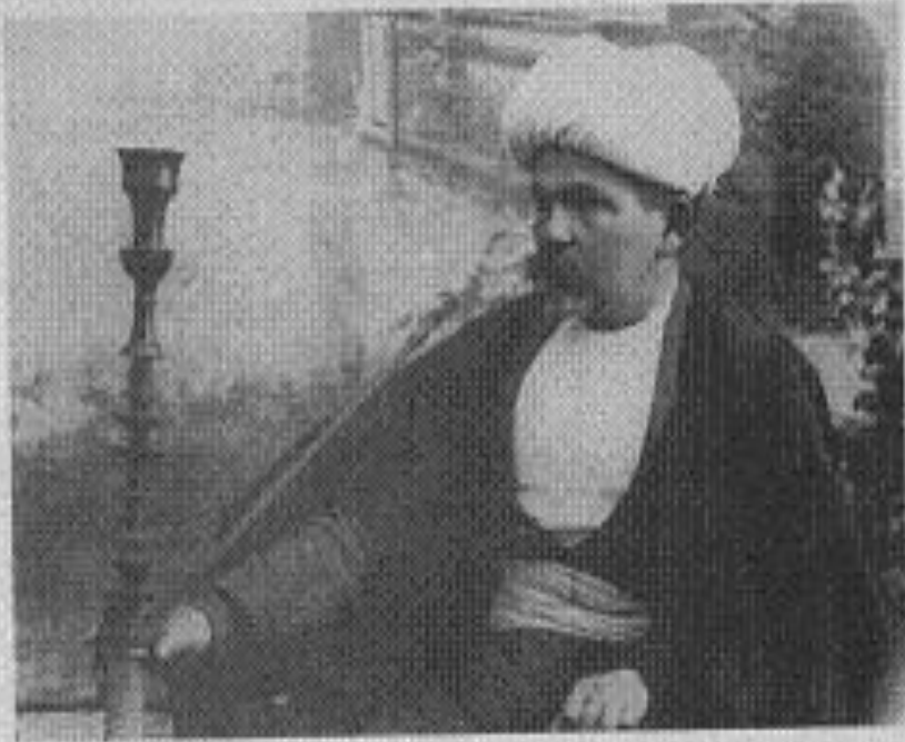
مسیونر که تعلیم گسترک و بیست رئیس مراغه را در مقدمه از این دستگاه جدید تقدیم نمود حضور المی حضرت ... (ص ۱۰۰ جلد چهارم)