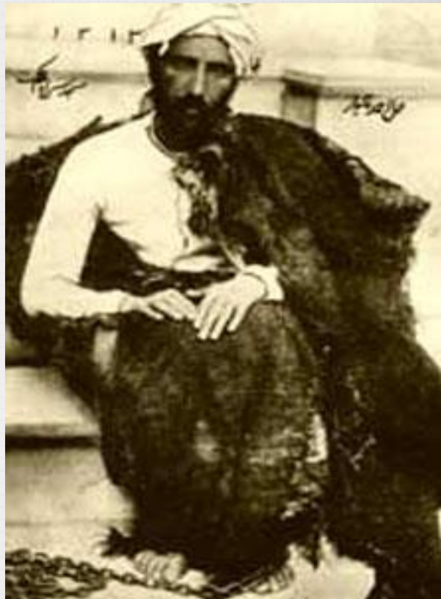
میرزا رضا کرمانی قاتل ناصر الدین شاه