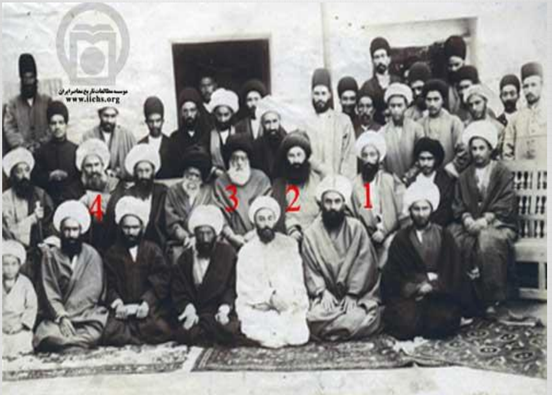
شماره ۲: حاج میرزا ابوالقاسم داماد ناصر الدین شاه و امام جمعه تهران نگاره شده توسط بهرام شیعی از استان بوشهر