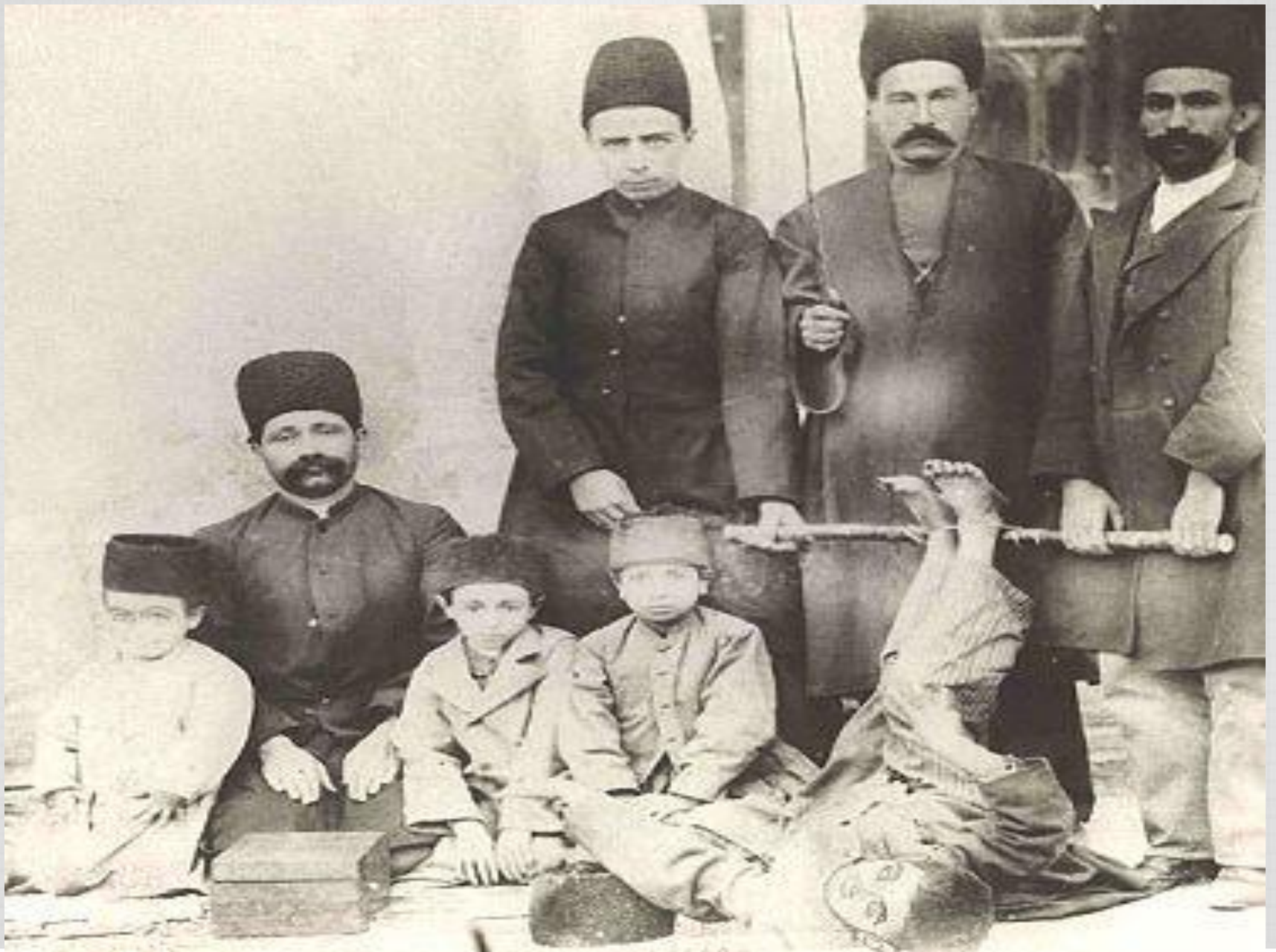
تپه شده توسط پیرام شیعی از استان بوشهر