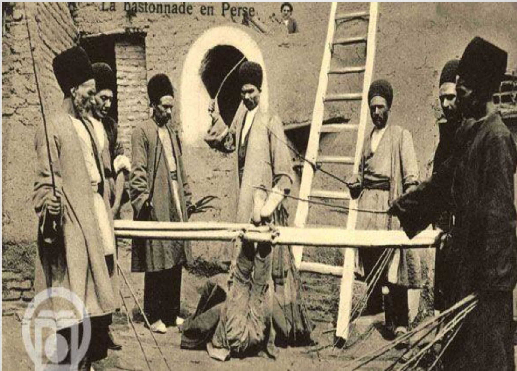
فلکی که به شکل کارت پستال در آمده جهت عبرت جهانیان!