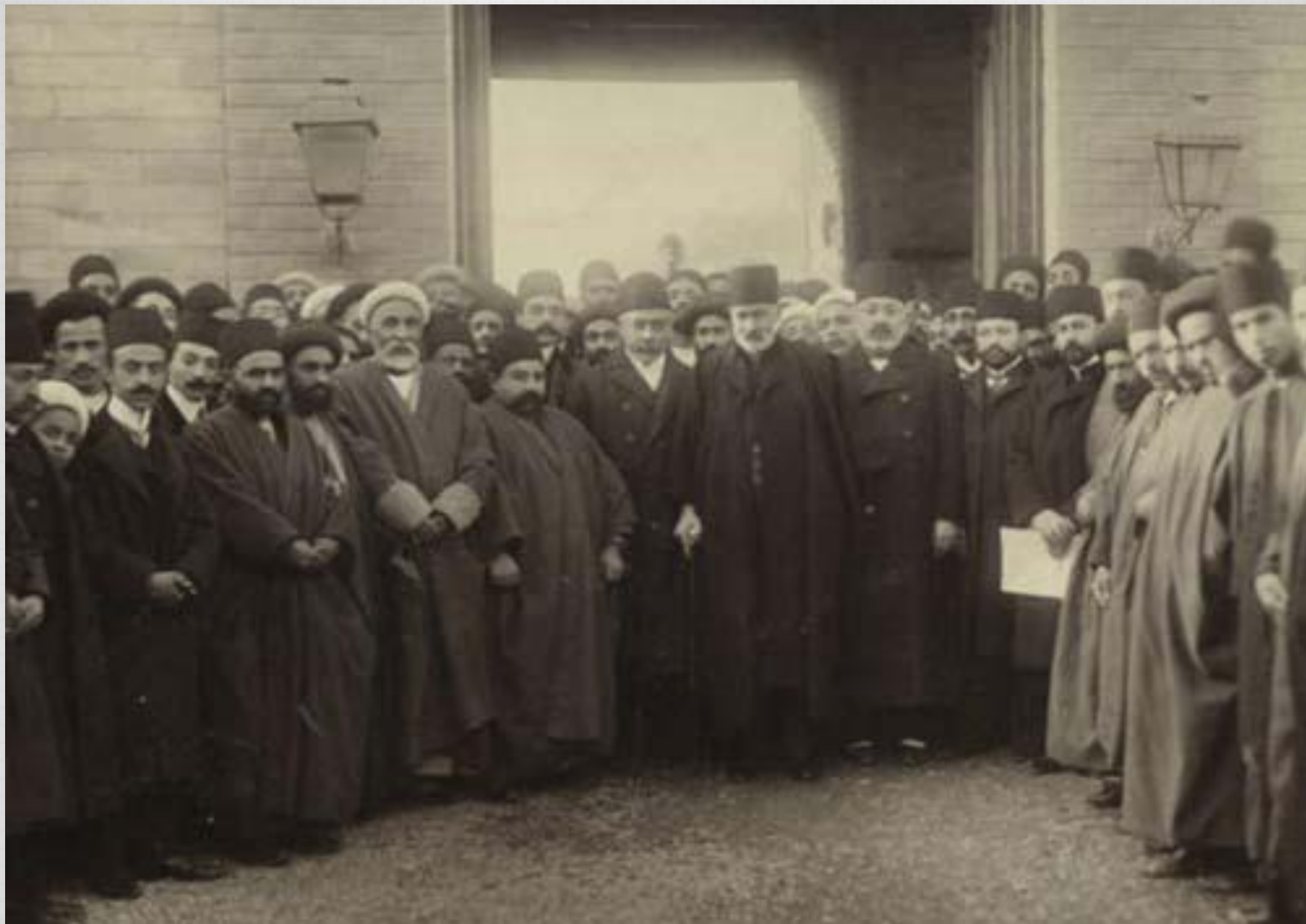
صدر اعظم ، وزیران و هیات تجار که دستخط مشروطه را در ۱۲۸۵ هجری شمسی به مجلس شورای ملی آوردند .