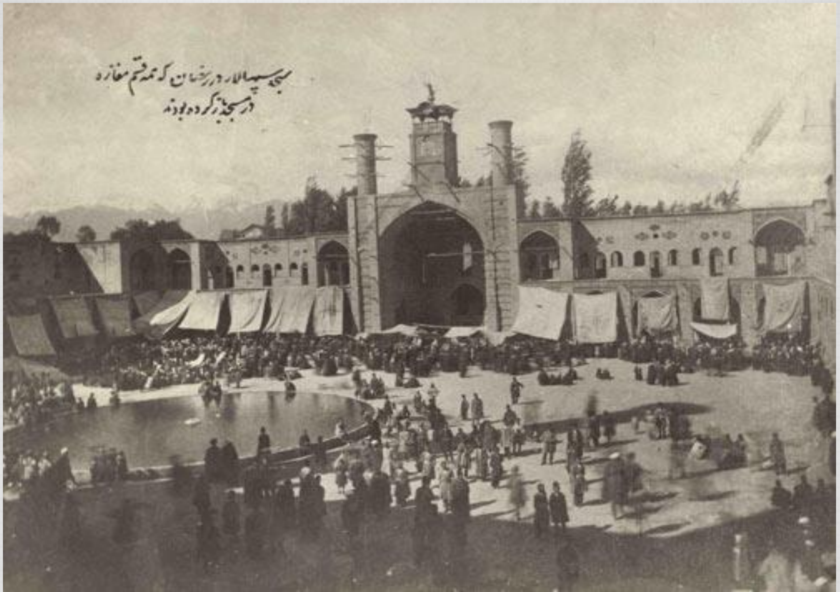
صحن مسجد سپهسالار ، بهارستان ، سال ۱۳۰۰