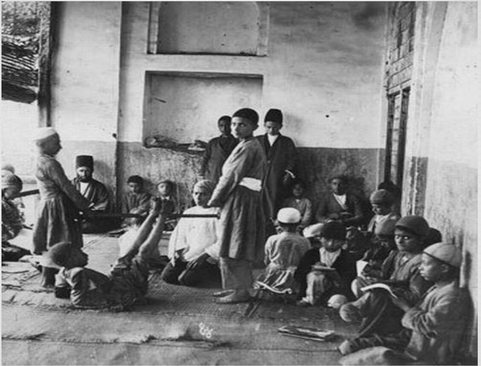
یکی از عکسهای مشهور چوب و فلکی مکتب‌خانه