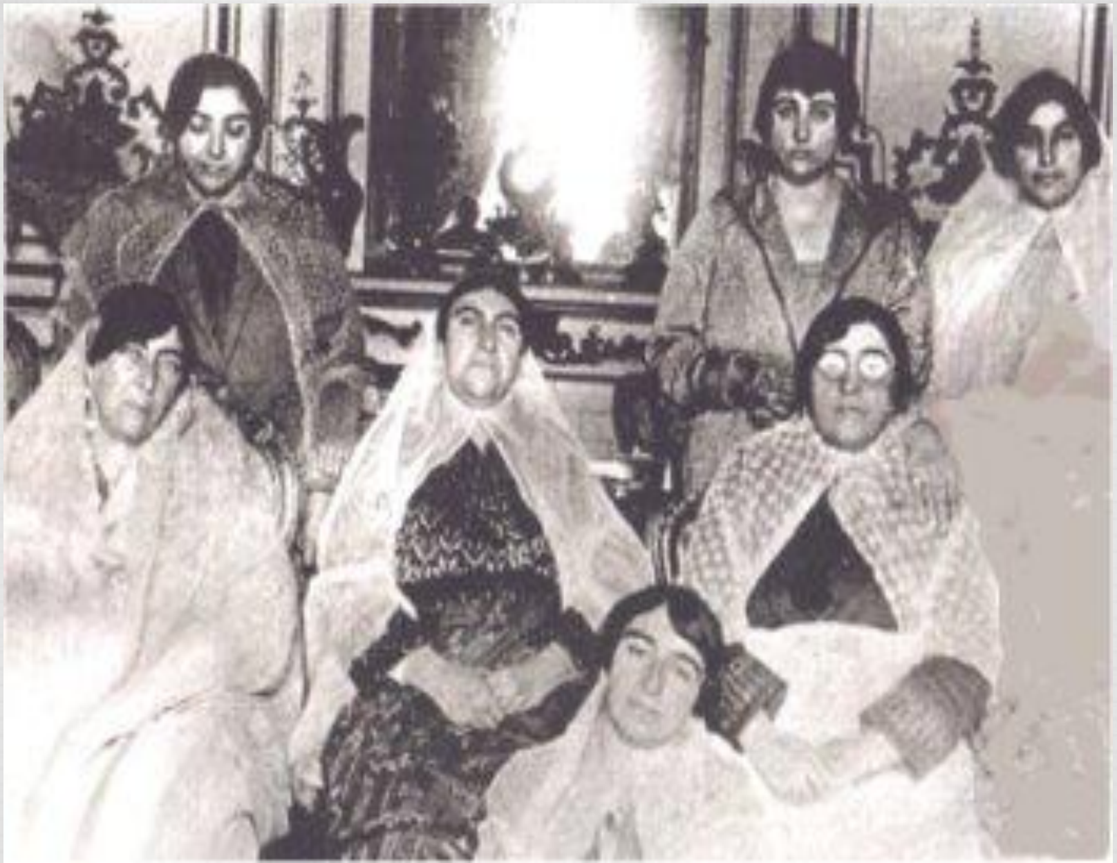
هفت نفر از دختران مظفرالدین شاه قاجار