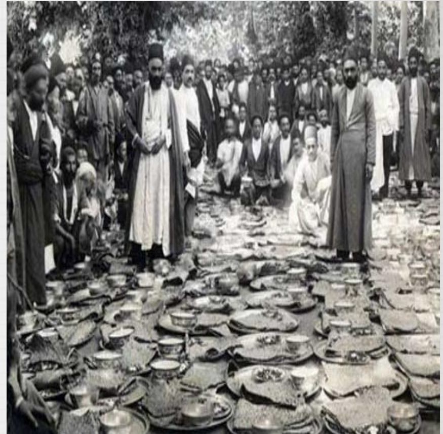
مشروطه خواهان در کنار سینیهای غذا در سفارت انگلیس