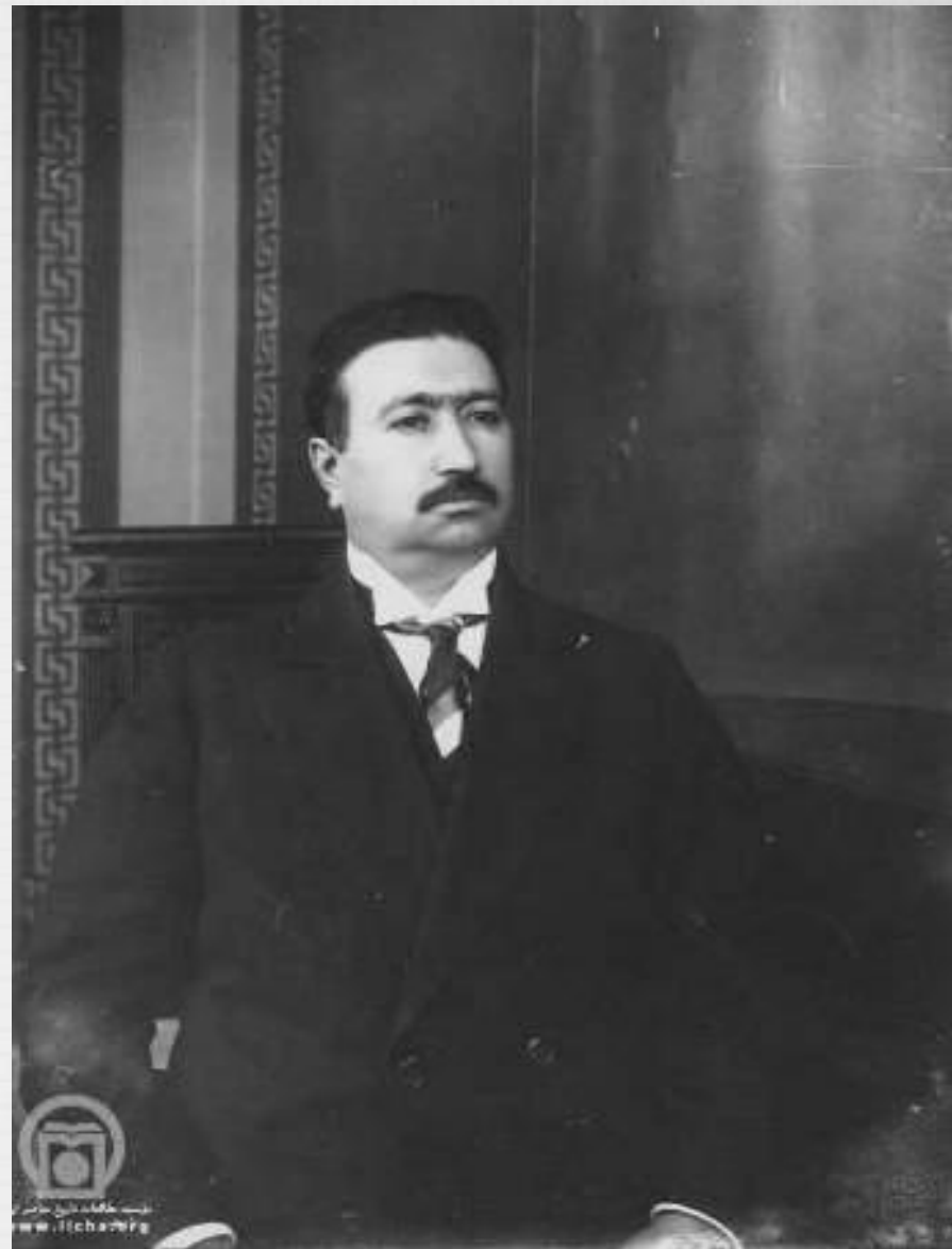
محمد علی میرزا ولیعهد مظفر الدین شاه