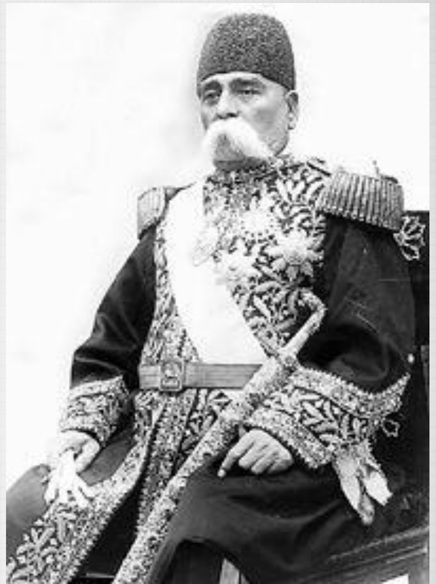
عين الدوله صدر اعظم مظفر الدين شاه