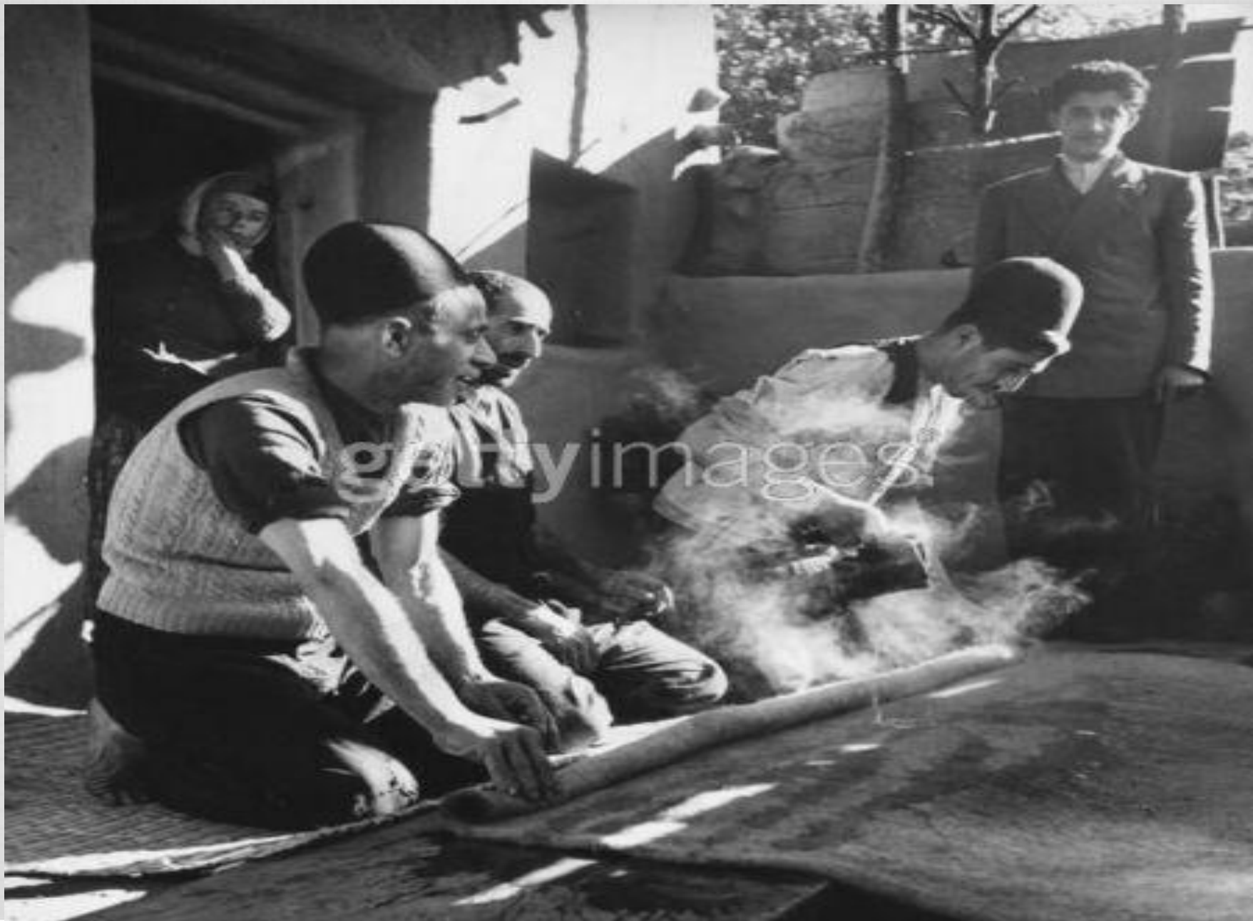
تپه شده توسط پیرام شیعی از استان بوشهر