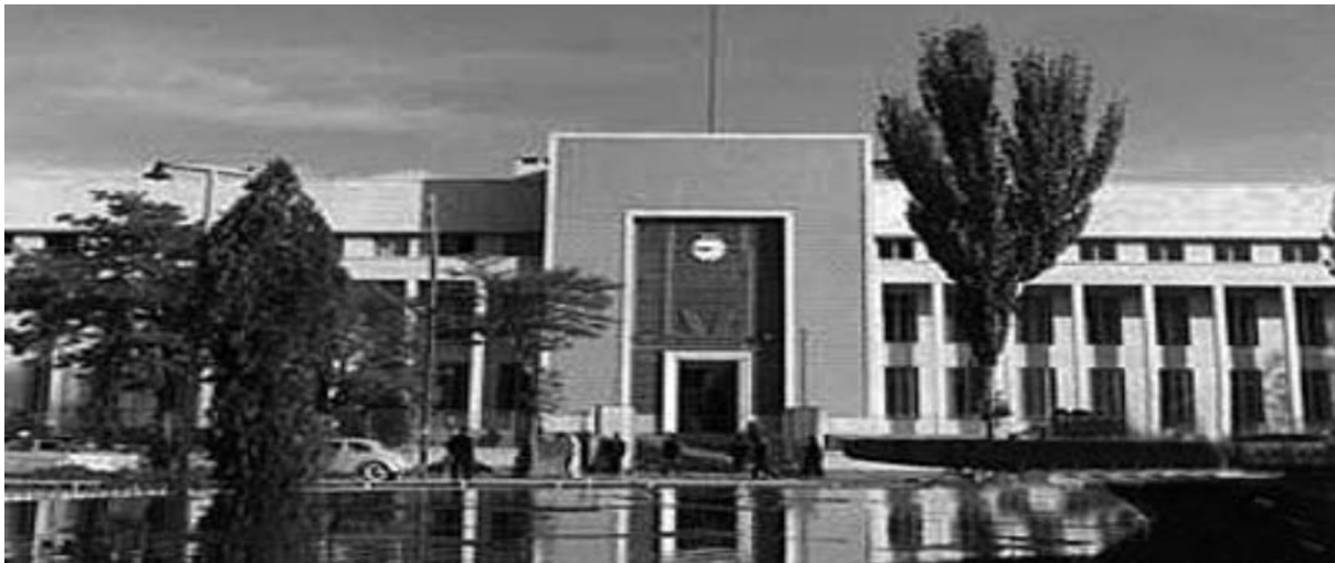
بانک استقراضی روس ها