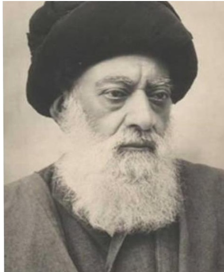
آیت الله سید محمد طباطبایی