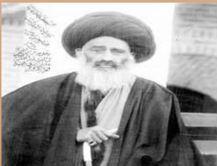
سید عبدالله بهبهانی

شخصیتهایی که بعد از به توپ بستن مجلس توسط قزاق ها دستگیر و شکنجه و تبعید شدند