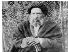
آیت الله مدرس

انتشار این خبر موجب مخالفت آزادی خواهان و شخصیت های سیاسی - مذهبی ایران شد و سرانجام با تلاشهای آیت الله مدرس اجرای این قرارداد متوقف شد.