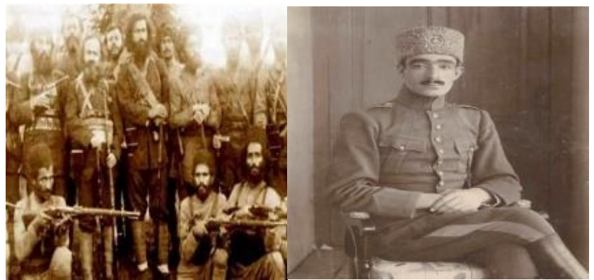
میرزا کوچک خان

قیام هایی که بعد از جنگ جهانی در واکنش به نفوذ بیگانه و فساد حاکم بر کشور شکل گرفت.