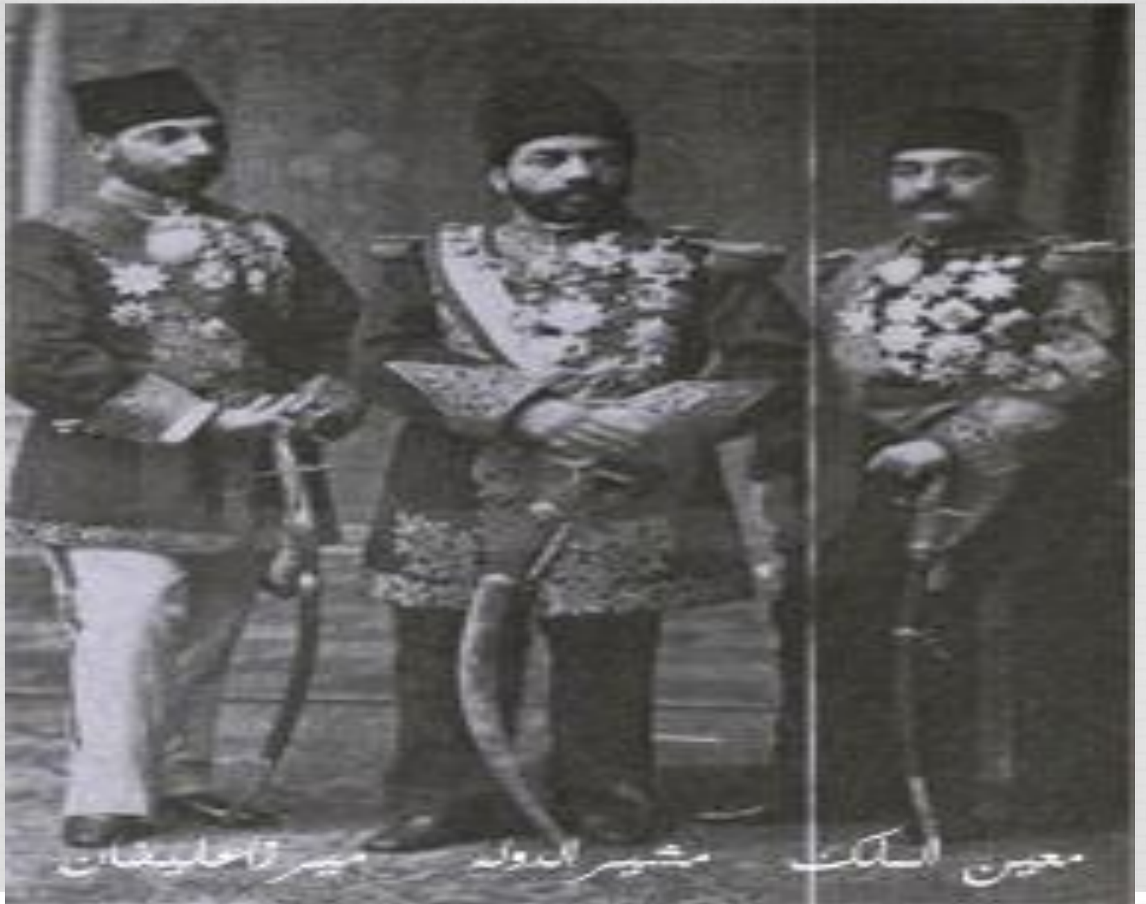
معین الملک مشیر الدولہ میرزا اعلیٰ خان