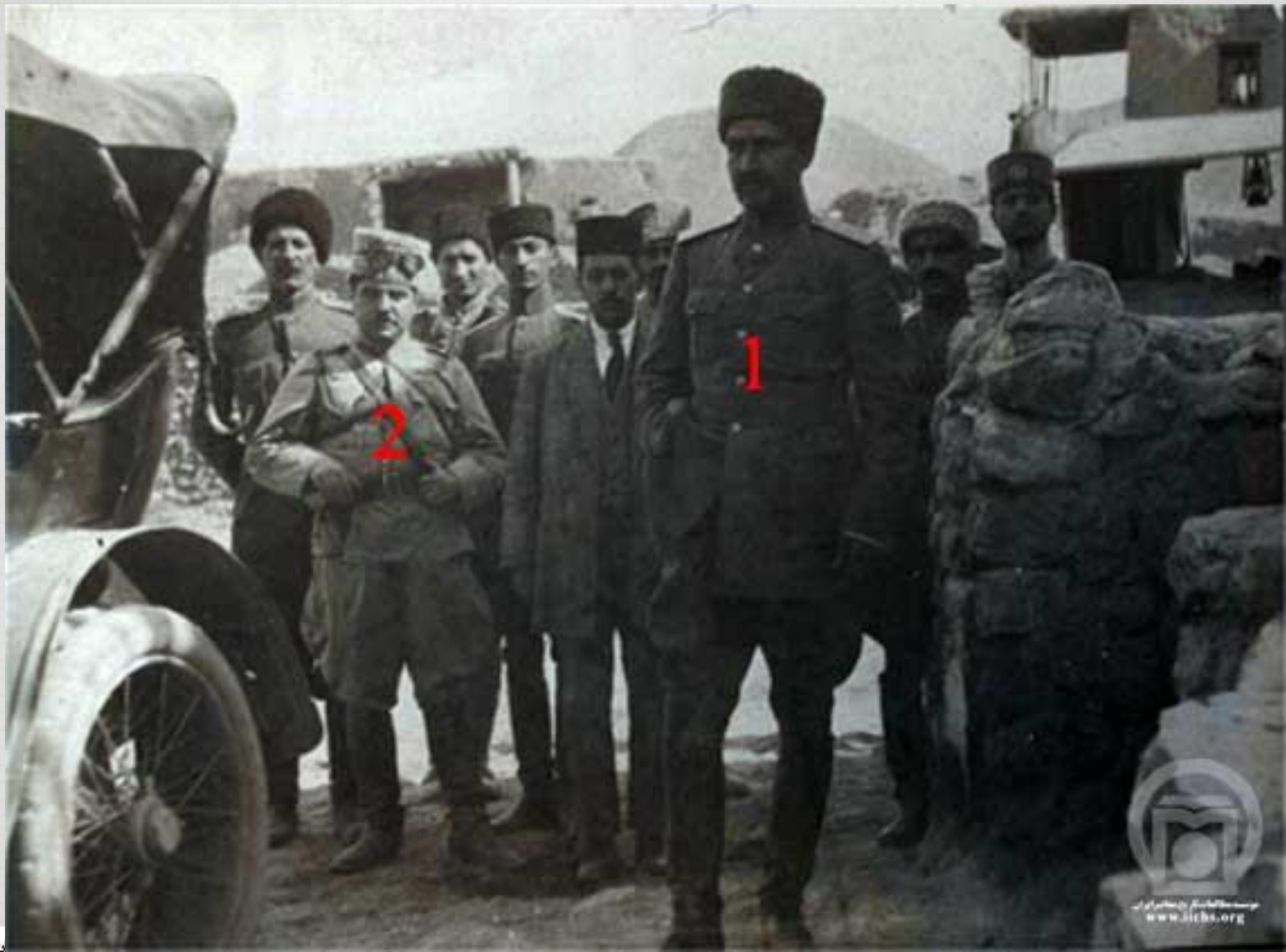
بازدید رضاخان پهلوی وزیر جنگ از یک مانور نظامی ۱. رضاخان پهلوی ۲. محمدصادق کویال