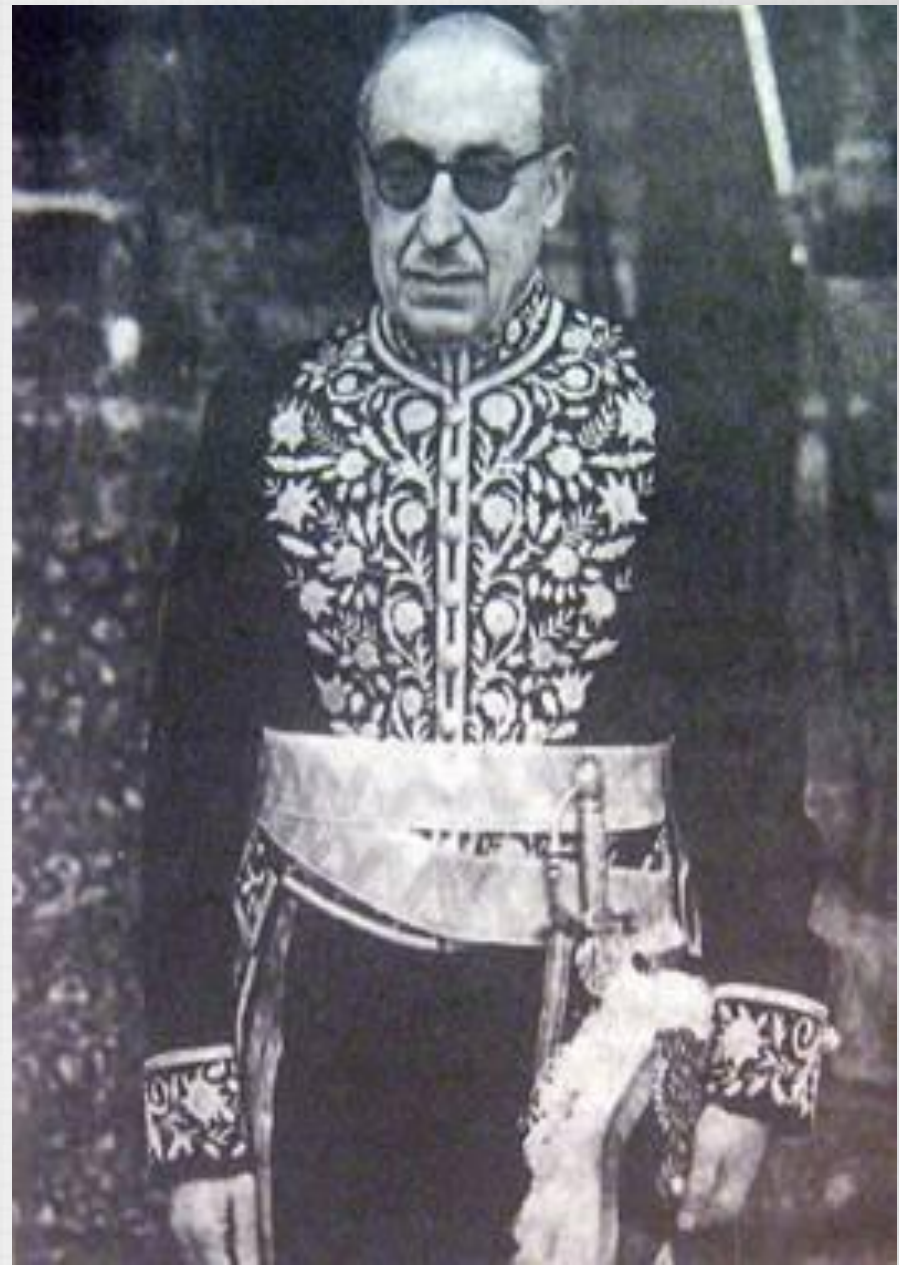
احمد قوام (قوام السلطنه)