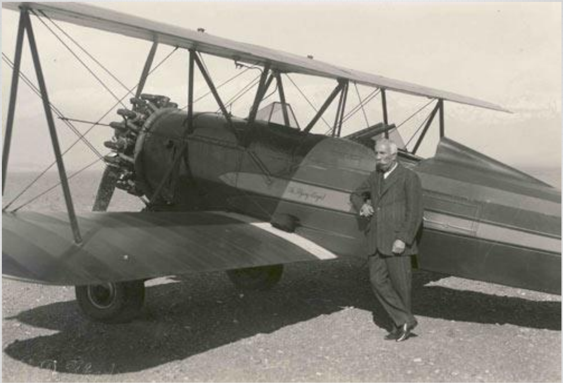
مستوفی الممالک از نخست وزیران عصر رضاشاه در فرودگاه دوشان تپه [ ۱۳۱۰ ]