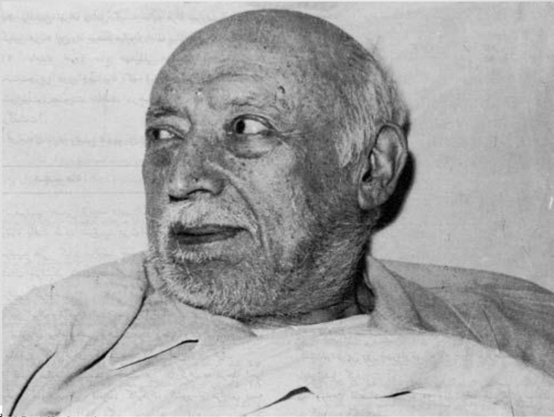
احمد قوام [ قوام السلطنه ] در آخرین روزهای حیات