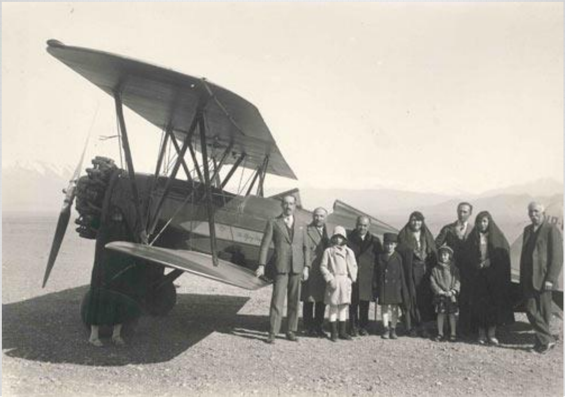
مستوفی الممالک از نخست وزیران عصر رضاشاه همراه با اعضای خانواده در فرودگاه دوشان تپه (۱۳۱۰) تپه سده توسط پیام سدهی از استان پارس