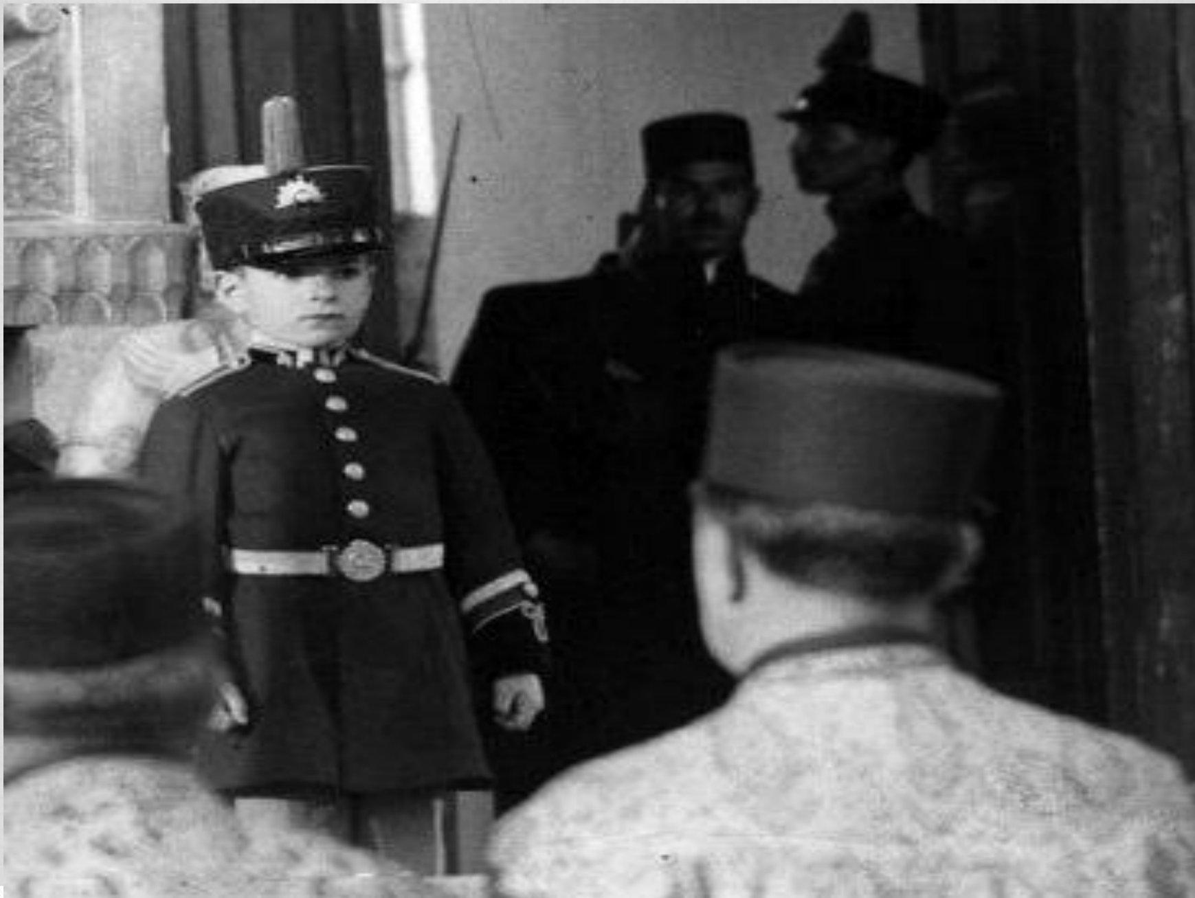
نیه سده توسط پیرام سیعی از استان بوشهر