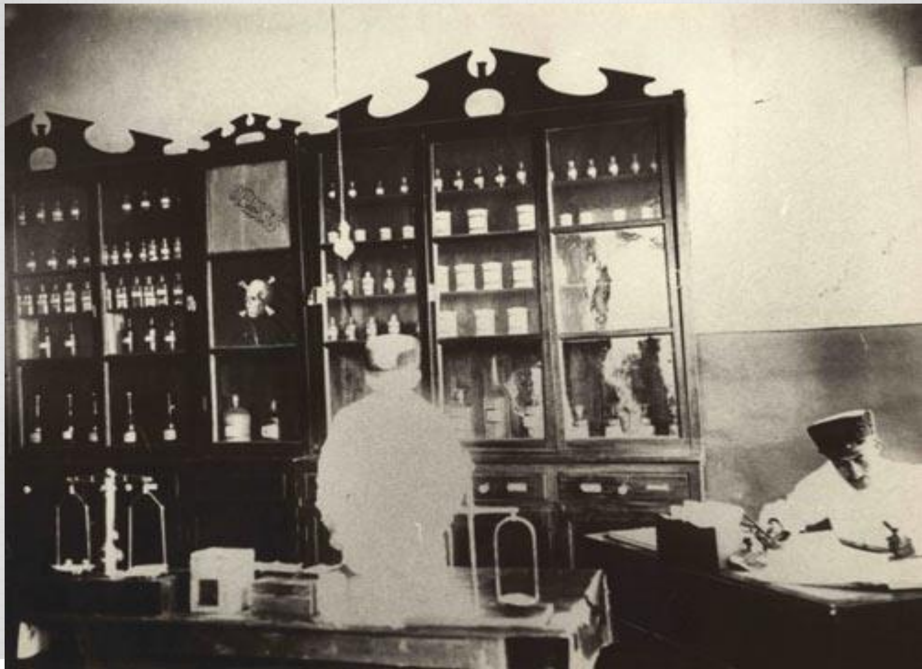
تیبه سده توسط پیرام سلیعی از استان بوشهر