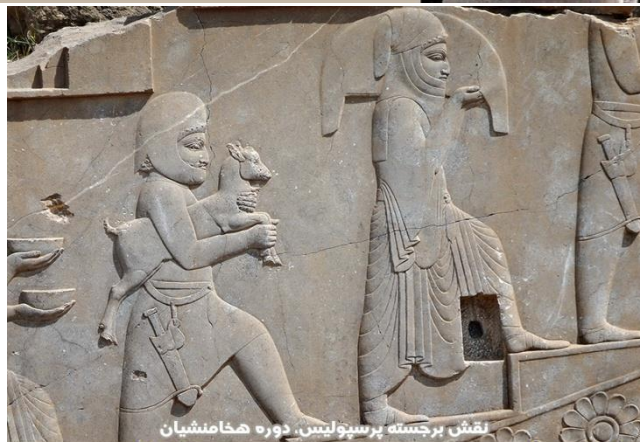
نقش برجسته پرسپولیس، دوره هخامنشیان تاریخچه حجاب: تصویر فوق نشان می دهد در دوره هخامنشیان، زنان ایرانی هنگام حضور در اجتماع، از روسری و لباس بلندتر نسبت به مردان استفاده می کردند.