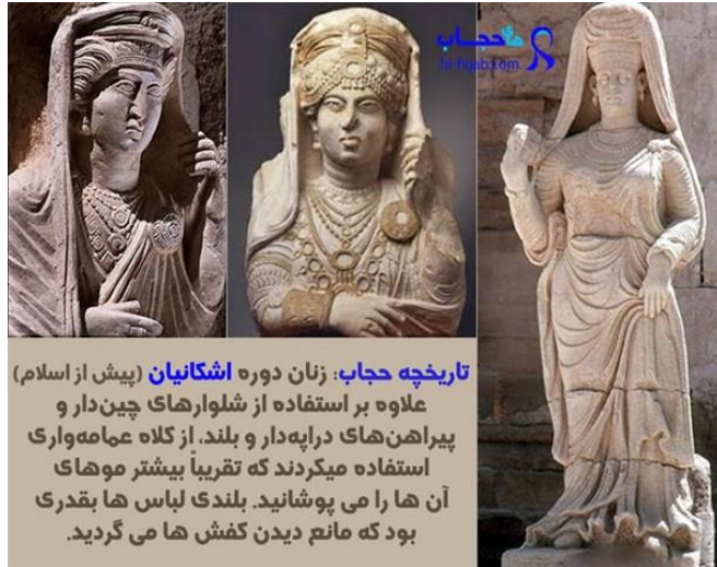
تاریخچه حجاب: زنان دوره اشکانیان (پیش از اسلام) علاوه بر استفاده از شلوارهای چین دار و پیراهن های دراپه دار و بلند، از کلاه عمامه واری استفاده میکردند که تقریباً بیشتر موهای آن ها را می پوشانید. بلندی لباس ها بقدری بود که مانع دیدن کفش ها می گردید.