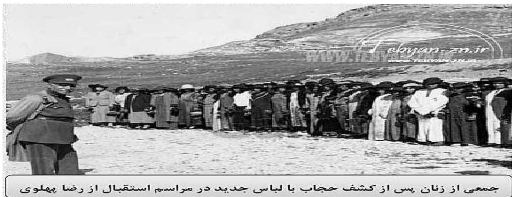
جمعی از زنان پس از کشف حجاب با لباس جدید در مراسم استقبال از رضا پهلوی