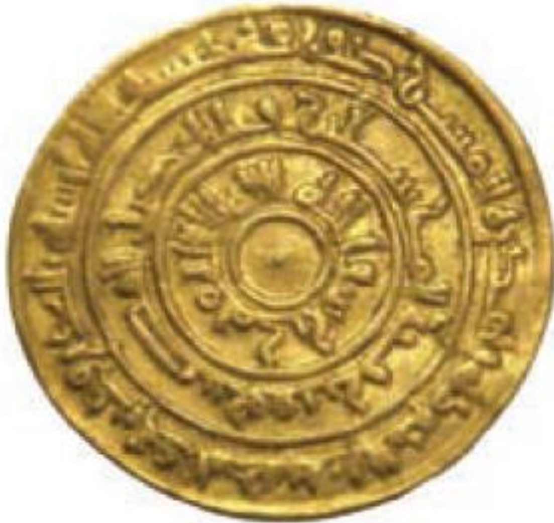
سكة المعز خليفة فاطمي