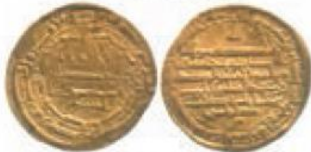
ضرب اهلهان سال ۱۲۰۲ ق

سکه‌هایی که در زمان ولایتعهدی امام رضا علیه السلام به نام ایشان در شهرهای مختلف ضرب شده است.