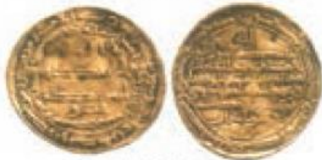
ضرب محمديهاری سال ۱۲۰۲ ق