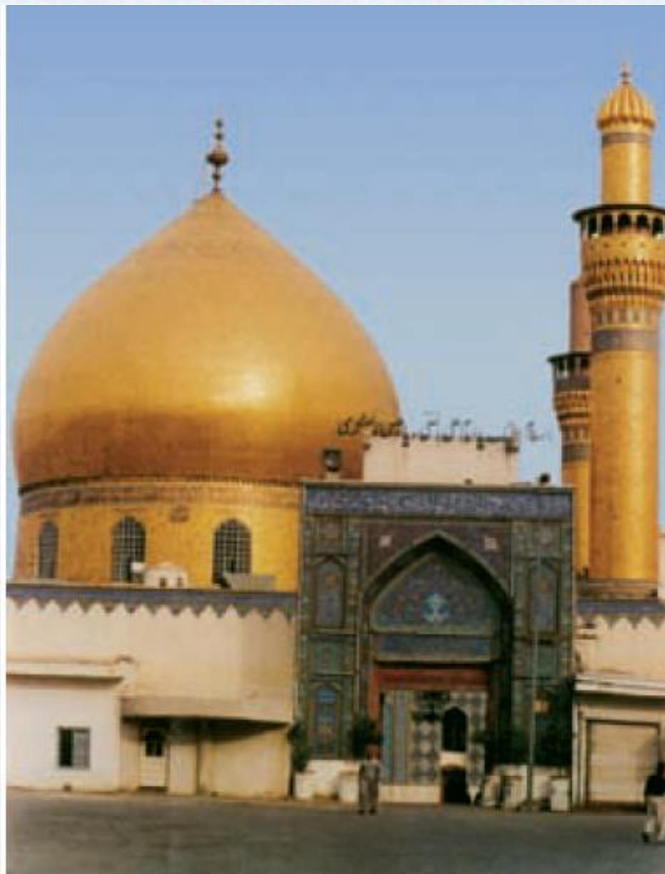
گنبد حرم امام هادی و امام حسن عسکری علیهما السلام