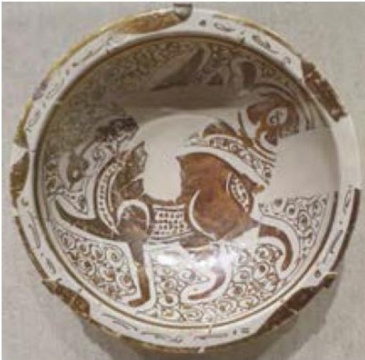
نمونه‌ای از ظروف سفالی عصر فاطمیان