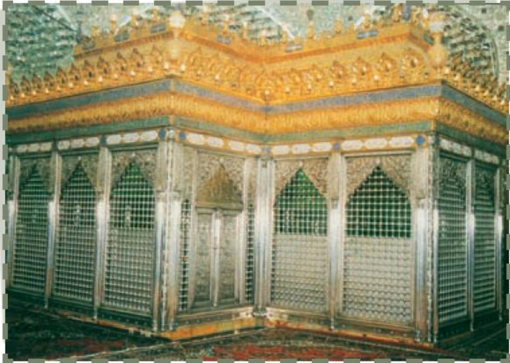
سامرا، ضریح مبارک امام هادی و امام حسن عسکری علیهما السلام