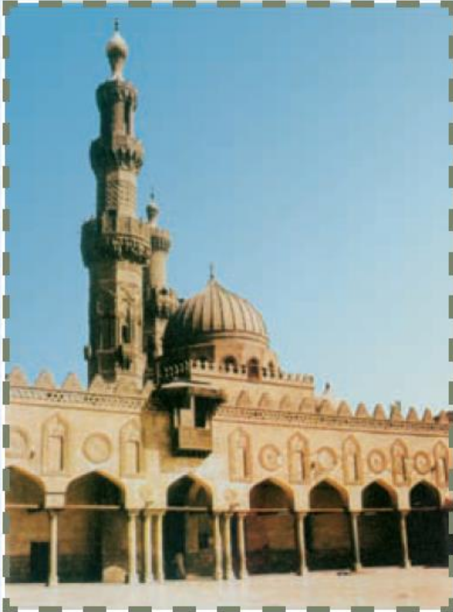
مسجد الازهر قاهره