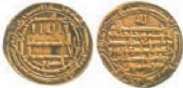
ضرب سمرقند سال ۱۲۰۲ ق