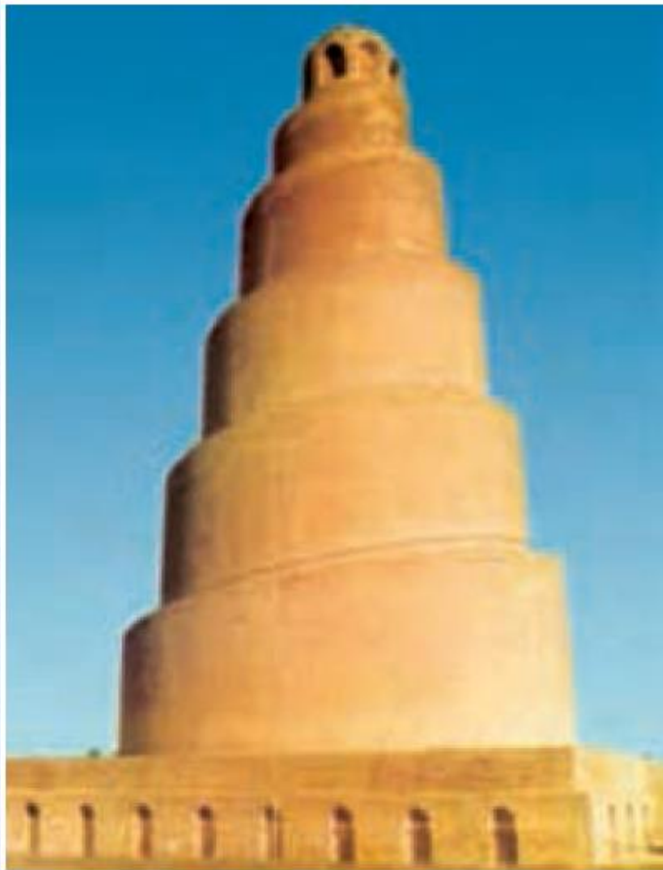
برج ملویه سامرا از آثار معماری دوران خلافت عباسی