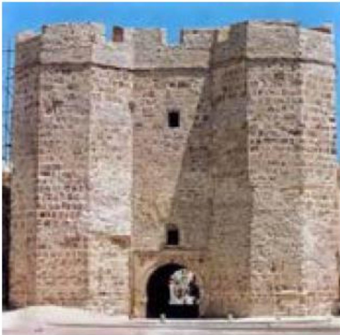
بقایای دروازه مهدیه نخستین پایتخت فاطمیان در تونس امروزی