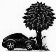
ب) برخورد ماشین با درخت

۱۰) در هریک از شکل های زیر نیروهای کنش و واکنش را مشخص کنید. (۱ نمره)