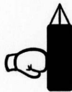
الف) برخورد دست با کیسه بوکس

کنش = نیروی ماشین به درخت واکنش = نیروی درخت به ماشین