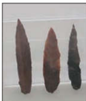
● تیغه سنگی، غار یافته بارسون، پارینه سنگی جدید (۴۰ تا ۱۸۰۰۰ سال پیش)