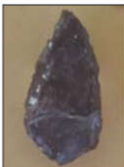
● خراشنده، غار دو آشفت کرمانشاه - پارینه سنگی میانی (۳۰۰ تا ۴۰۰۰۰ سال پیش)