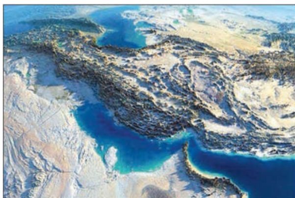
نقشه طبیعی فلات ایران

پاسخ: فلات ایران از شمال به دریای طبرستان (مازندران) و دریاچه اورال - از غرب به جلگه بین النهرین - از جنوب به خلیج فارس ، دریای مکران (عمان) و اقیانوس هند - از شرق به جلگه سند