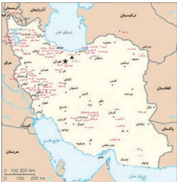
● سکونتگاه‌های پیش‌آزمایی ایران

پاسخ: غالب شهرها و روستاهای کنونی ایران در همان محل محوطه های باستانی و یا اطراف آنها شکل گرفته است.