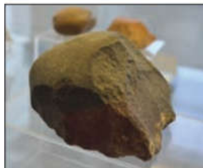
● ابزار سنگی، پارینه سنگی قدیم - شیوه تو - مهاباد