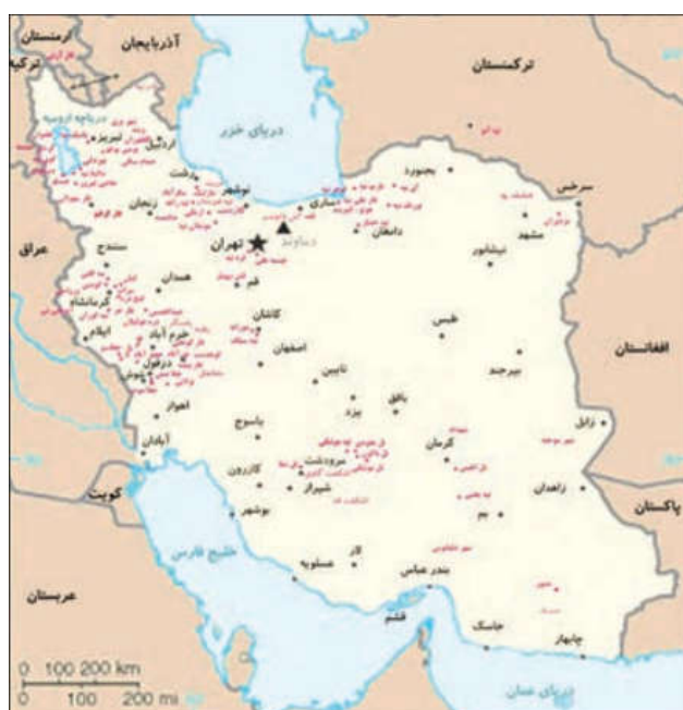
● سکونتگاه های پیش آریایی ایران