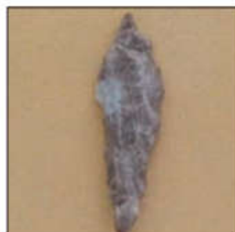
● سنگ نوک تیز، هلیلان - ایلام، فرا پارینه سنگی (۱۸ تا ۱۲۰۰۰ سال پیش)