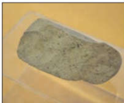
● ابزار سنگی، پارینه سنگی قدیم - کشف رود - خراسان رضوی

کدام یک از تصاویر زیر کهن ترین آثار کشف شده از انسان در ایران را نشان می دهد؟