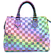
b a g