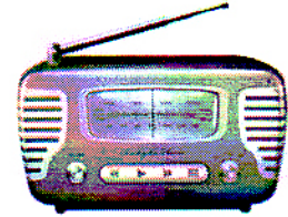
r a dio

8. از کلمات داخل پرانتز برای هر جمله در زیر استفاده کنید. یک کلمه اضافی است. (چهار نمره)