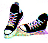
sh o es