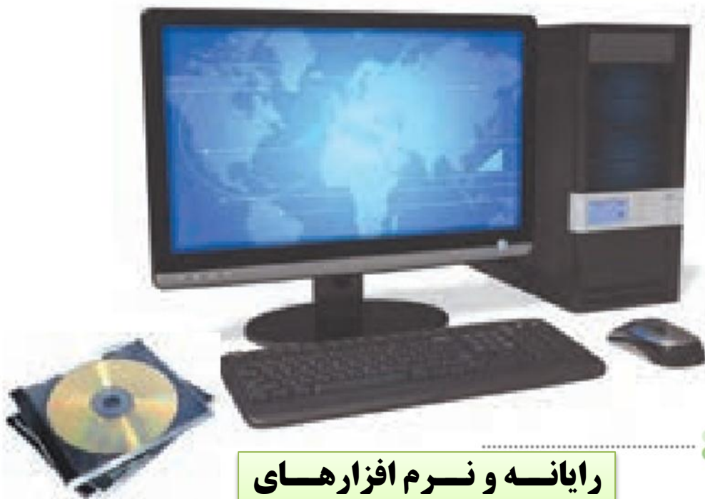
رایانه و نرم افزارهای جغرافیایی