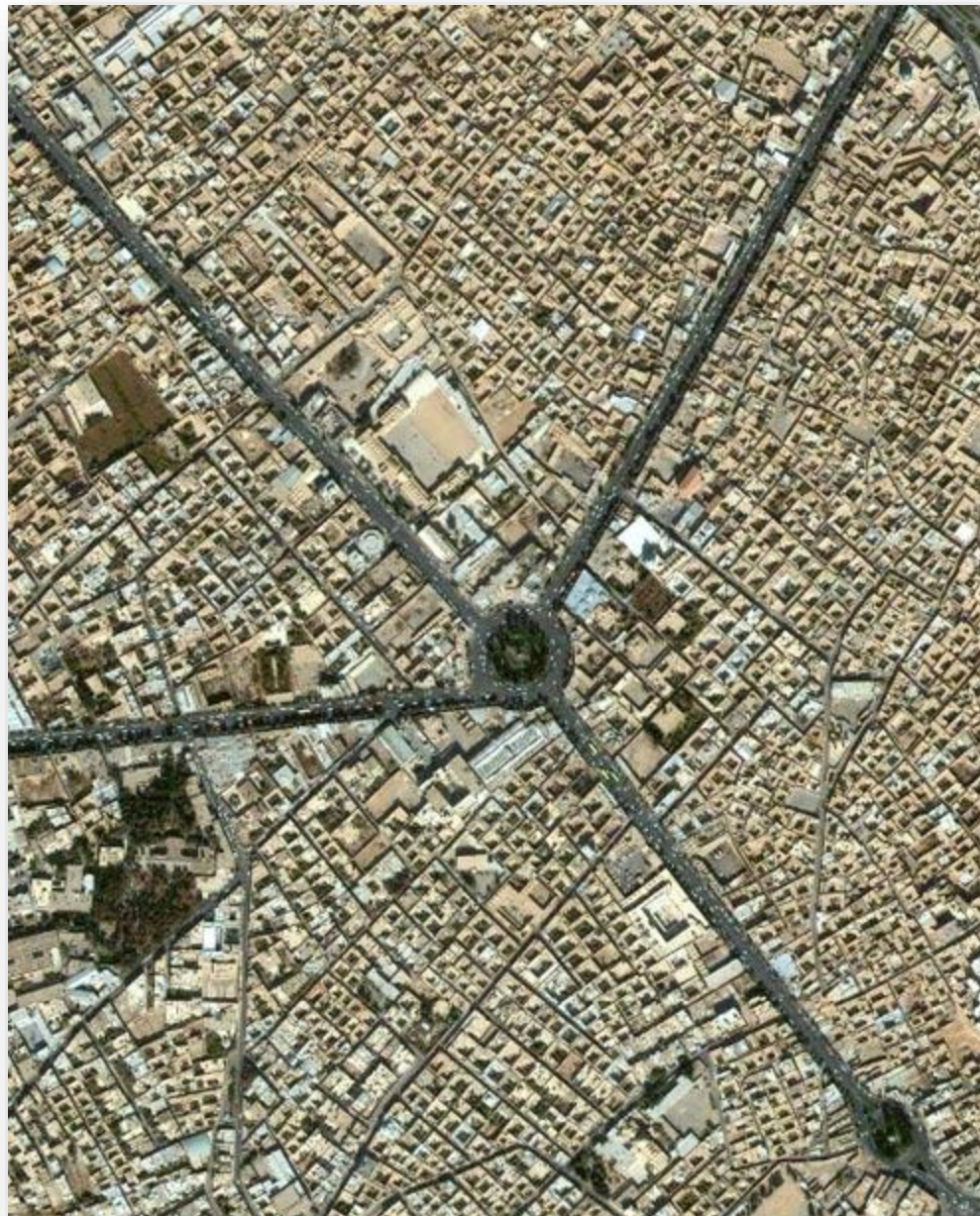
عکس هوایی از شهریزد