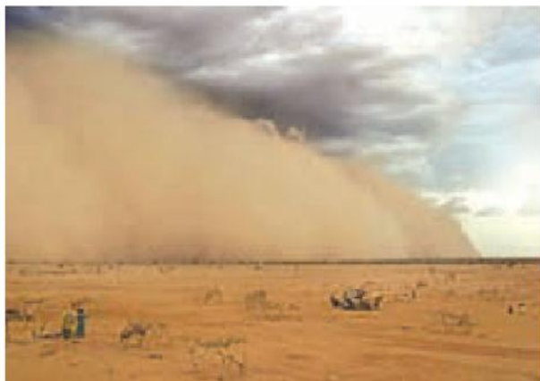
گردوغبار در مناطق غربی ایران