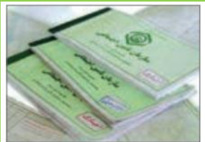
■ شکل ۱۲-۳- دفترچه تأمین درمان