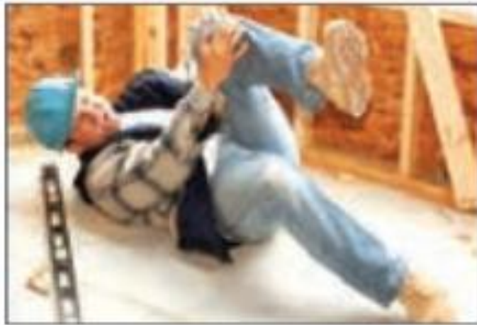
■ شکل ۱۴-۳- حوادث ناشی از کار