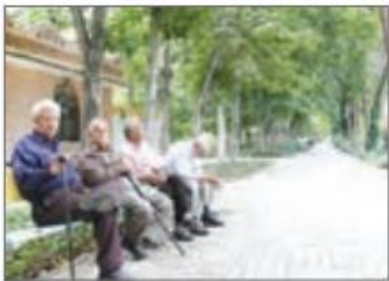
■ شکل ۱۳-۳- بازنشستگی