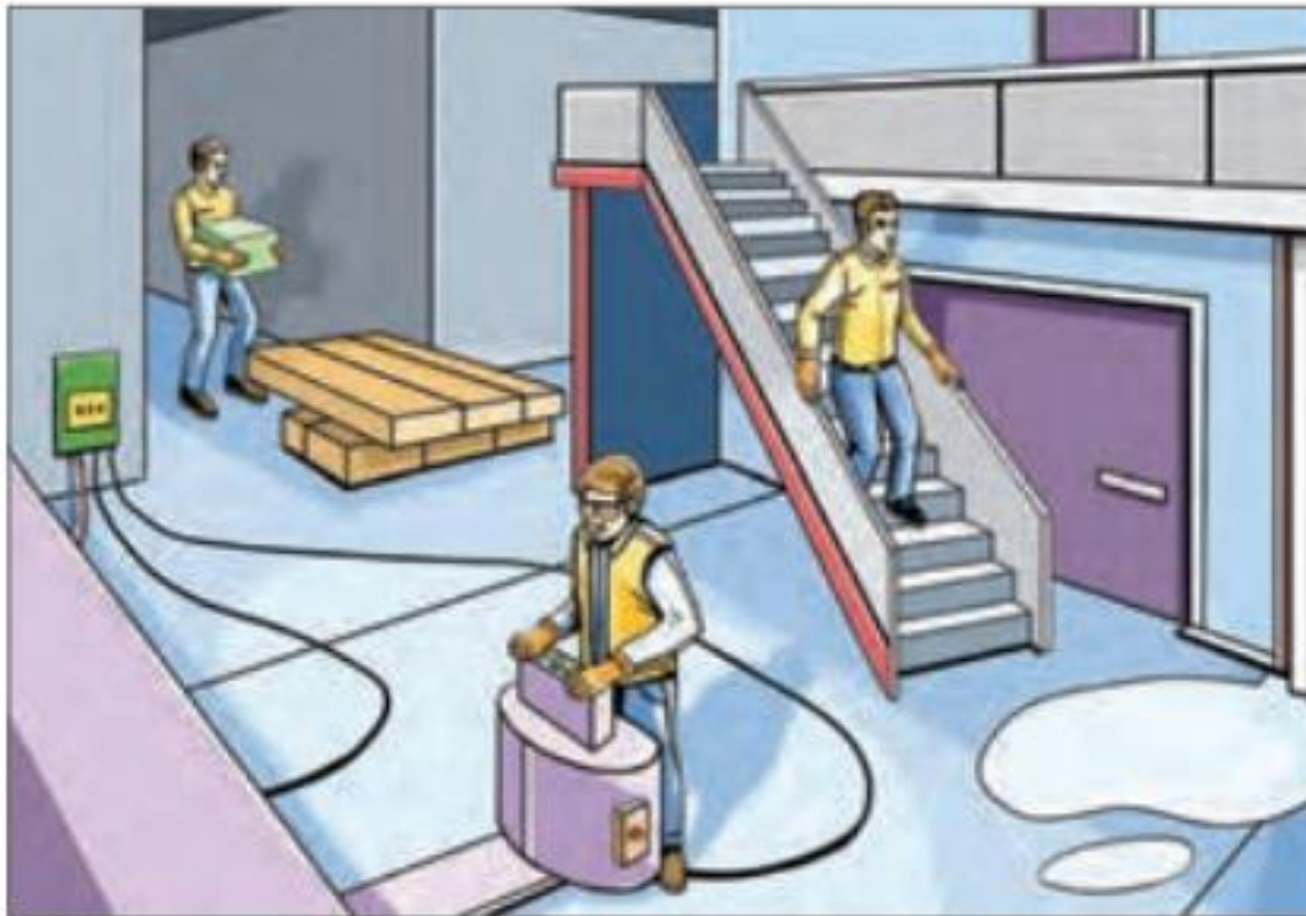
شکل ۴-۶ - مخاطرات محیط کار در فضای سر بسته دانلود از آپلیکیشن پادرس

تصویرهای زیر مخاطراتی که در محیط‌های کاری مختلف وجود دارد را نشان می‌دهد. مخاطرات را شناسایی کنید، و راهکارهایی برای کنترل آنها ارائه دهید.