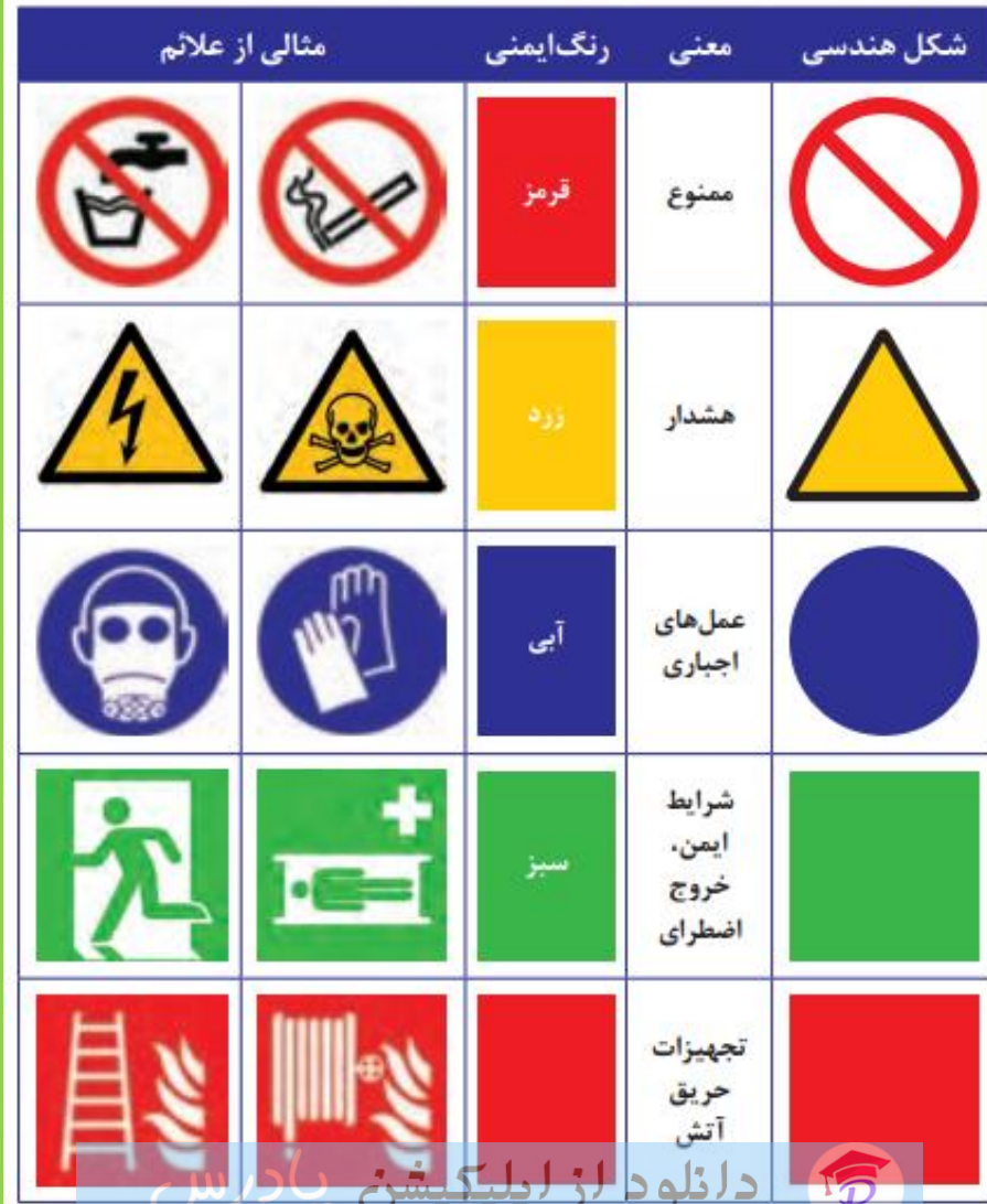
جدول ۳-۴ - علائم ایمنی