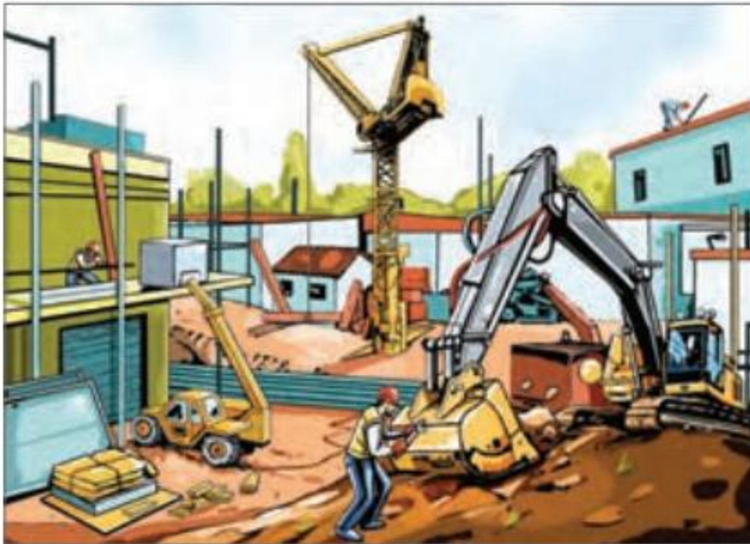
شکل ۷-۴- مخاطرات محیط کار در محیط باز دانلود از اپلیکیشن پادرس