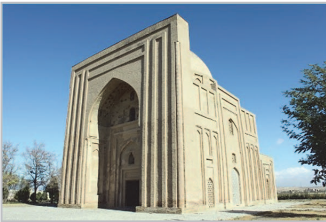
قلعه طبرک و بارو و حصار شهر، از آثار برجای مانده از دوران خلفای عباسی در ایران (ری)