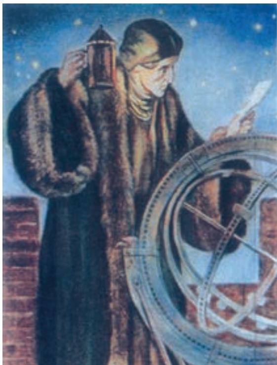
کوپرنیک در حال رصد ستارگان