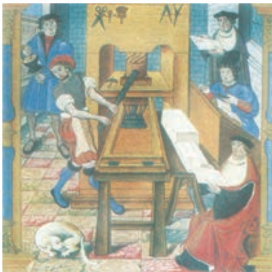
کارگاه چاپ اواخر قرن ۱۵

در اواسط قرن شانزدهم نیکلاس کوپرنیک ۱ در رسالهٔ گردش اجرام سماوی، نظریهٔ چرخش زمین به دور خورشید را مطرح کرد. پیش از این، براساس نظریهٔ زمین مرکزی ۲ بطلمیوس، کلیسا و دانشمندان بر این باور بودند که زمین ثابت و خورشید بر گرد آن می‌چرخد. با مطالعات برخی از دانشمندان از جمله کیپلر ۳ نظریهٔ کوپرنیک اثبات شد. اختراع تلسکوپ توسط گالیله ۴ ، استاد دانشگاه پیزا، فرضیه‌های کوپرنیک را بیش از پیش مورد تأیید قرار داد. با گسترش روابط اروپاییان با جهان اسلام از دورهٔ جنگ‌های صلیبی به بعد، پزشکی و داروسازی در اروپا نیز دچار تحول شد. ویلیام هاروی ۵ در زمینهٔ کارکرد قلب و چگونگی گردش خون به موفقیت‌های مهمی دست یافت. در فیزیک و ریاضیات نیز پیشرفت‌هایی صورت گرفت و در قرن ۱۷م با وسعت بیشتری ادامه یافت. در زمینهٔ جغرافیا و نقشه‌برداری نیز اروپاییان از تجربیات مسلمانان بهره‌های فراوانی بردند و به پیشرفت‌های چشمگیری نایل آمدند.