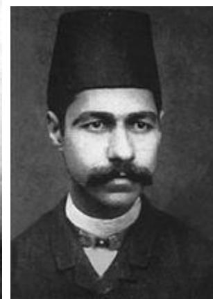
میرزا آقا خان کرمانی