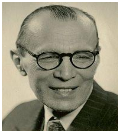
ملک الشعرای بهار