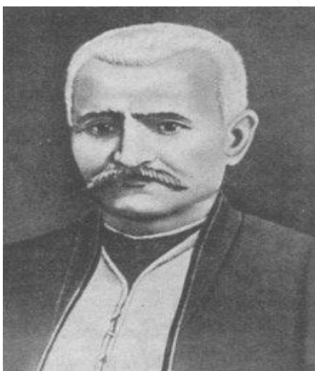
میرزا فتحعلی آخوند زاده