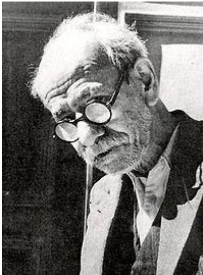
علی اکبر دهخدا