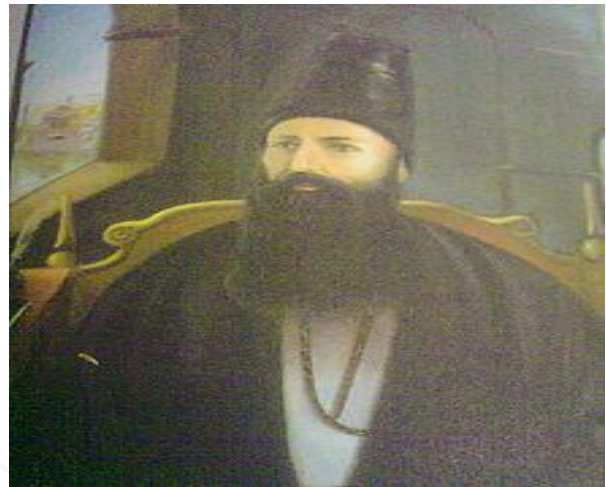
قائم مقام فراهانی