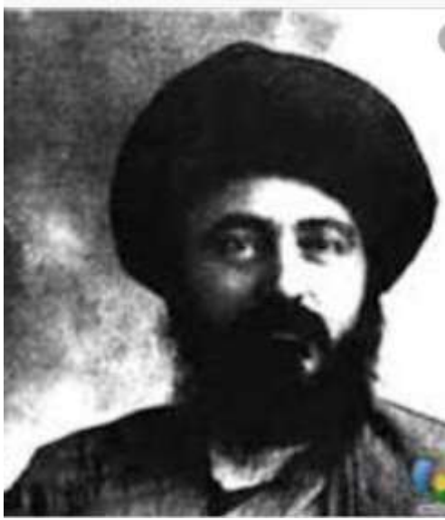
* ادیب الممالک فراهانی:

فعالیت اصلی وی روزنامه نگاری و سردبیر روزنامه «مجلس» بود شعرش از زندگی سیاسی اش جدا نبود و بسیاری از حوادث و اوضاع روزگار را بیان می نمود. دیوان وی حاوی: ترجیع بندها، قصاید و مسمط . بیشتر «قصیده» می سرود و مضمون آنها وطنی، سیاسی و اجتماعی بود.