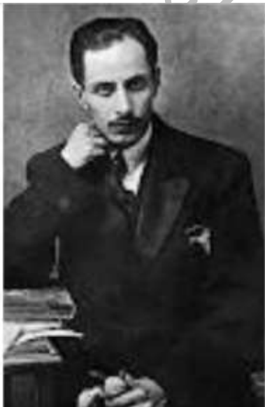
* میرزاده ی عشقی:

فعالیت اصلی وی روزنامه نگاری و سردبیر روزنامه «مجلس» بود شعرش از زندگی سیاسی اش جدا نبود و بسیاری از حوادث و اوضاع روزگار را بیان می نمود. دیوان وی حاوی: ترجیع بندها، قصاید و مسمط . بیشتر «قصیده» می سرود و مضمون آنها وطنی، سیاسی و اجتماعی بود.