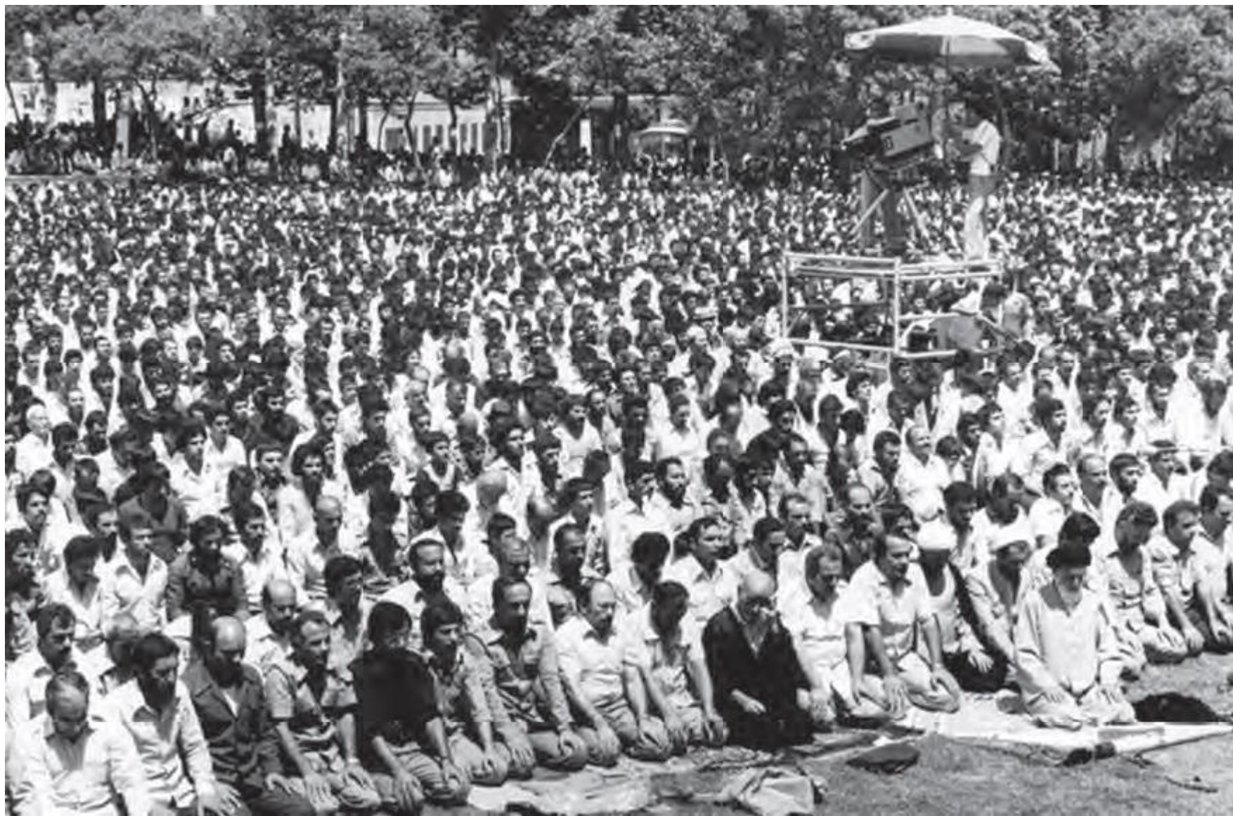
اقامة نخستين نماز جمعة تهران به امامت آیت الله طالقانی در دانشگاه تهران دانشود از اپلیکیشن پادرس