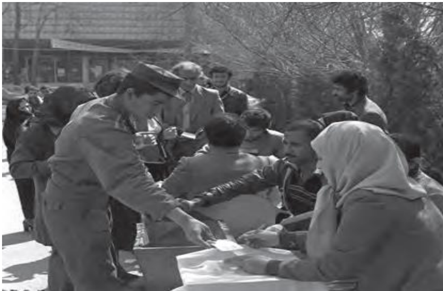
همه پرسی جمهوری اسلامی ۱۰ و ۱۱ فروردین ۱۳۵۸