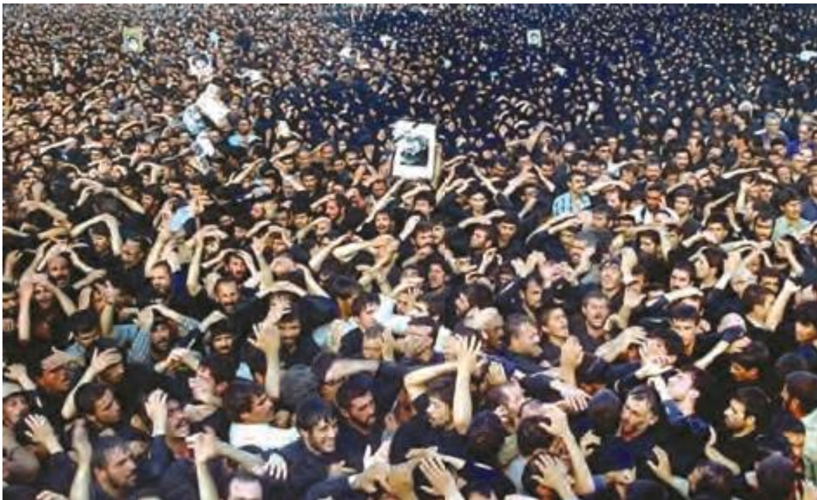
نمایی از تشییع جنازه میلیونی امام خمینی