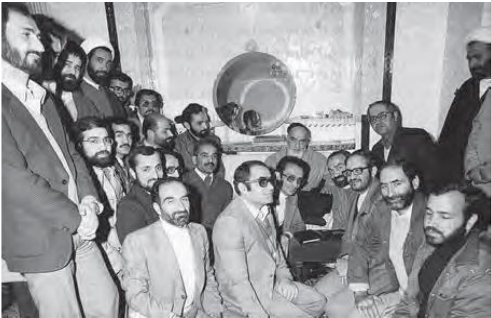
اعضای هیئت دولت شهید محمدعلی رجایی در دیدار با حضرت امام (ره)