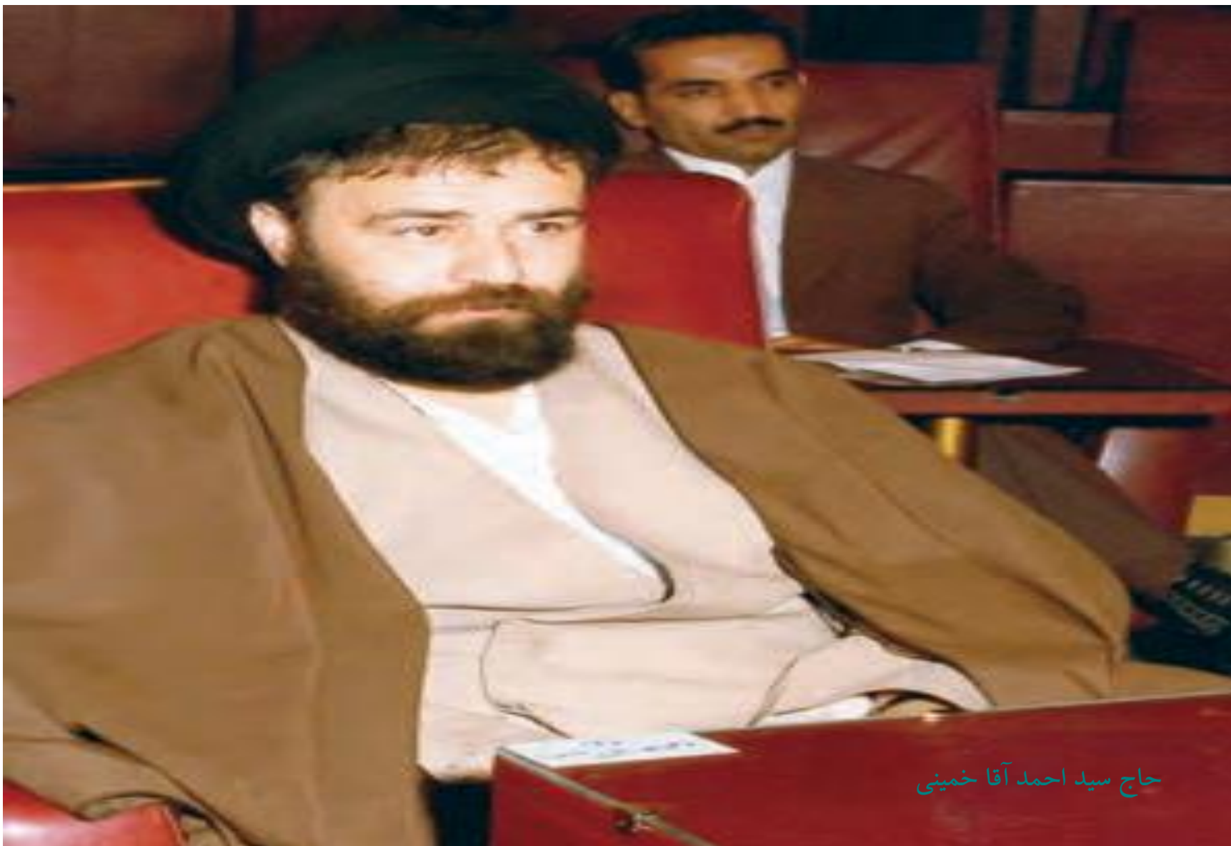
حاج سيد احمد آقا خميني