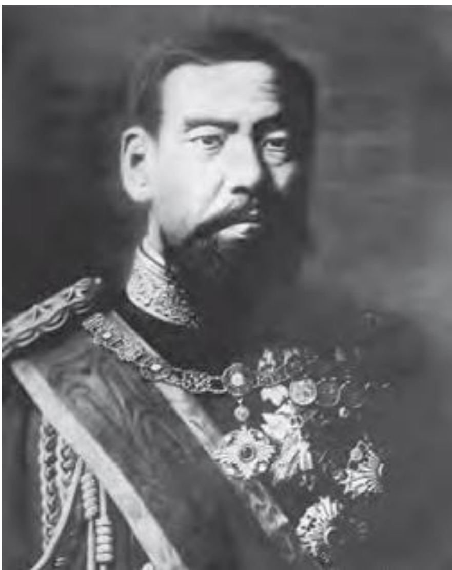
امپراتور ژاپن (Mutsuhito) موتسو هیتو ۱۸۶۸-۱۹۱۲ م در دوران انقلاب میجی