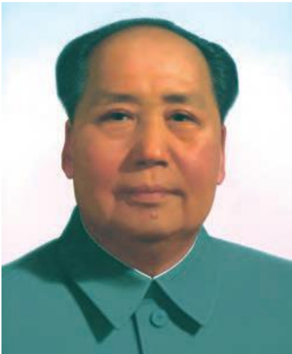
مائو، بنیان گذار جمهوری خلق چین