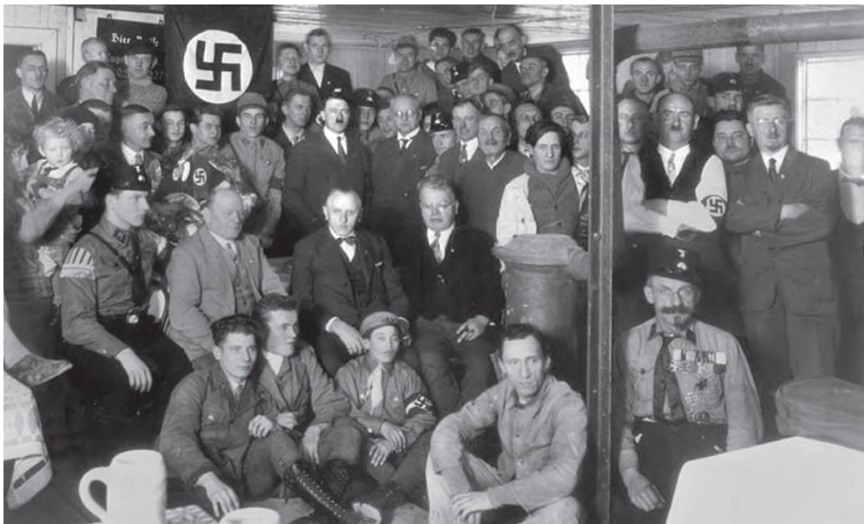
هیتلر و اعضای حزب نازی دسامبر ۱۹۳۰