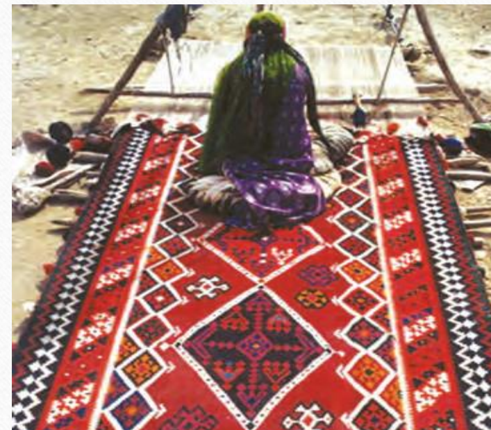
گلیم بافی عشایر قشقایی استان فارس