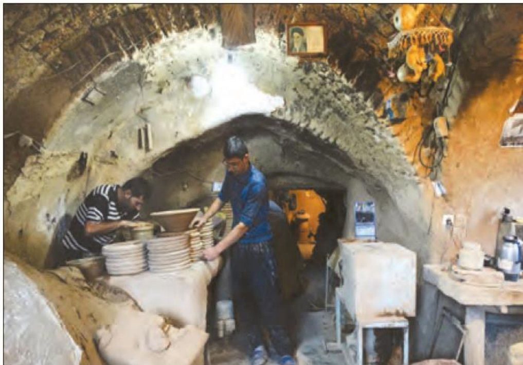
کارگاه سفال - لالچین - همدان

آیا تصاویر زیر می تواند فرهنگ و دیدگاه مناطق تولید کننده آن را نشان دهد؟