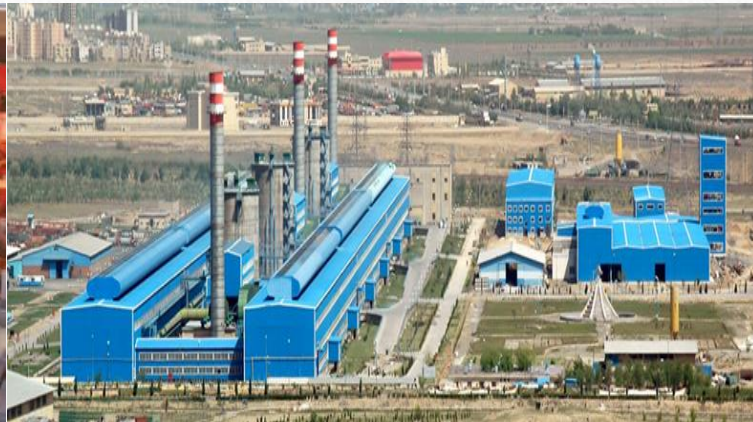
شرکت آلومینیوم ایران (ایرالکو) در اراک