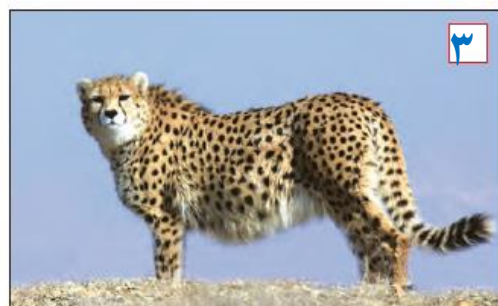
یوزپلنگ ایرانی (آسیایی) - استان سمنان