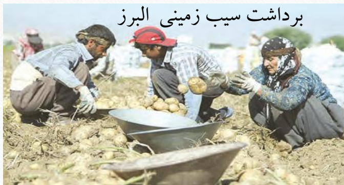
برداشت سیب زمینی البرز

تنوع آب و هوایی در ایران، موقعیت مساعدی را برای تولید انواع محصولات زراعی فراهم آورده است.