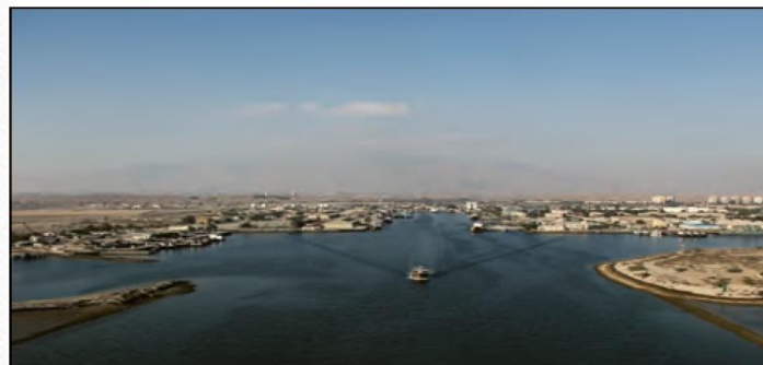
بندر شهید رجایی - هرمزگان