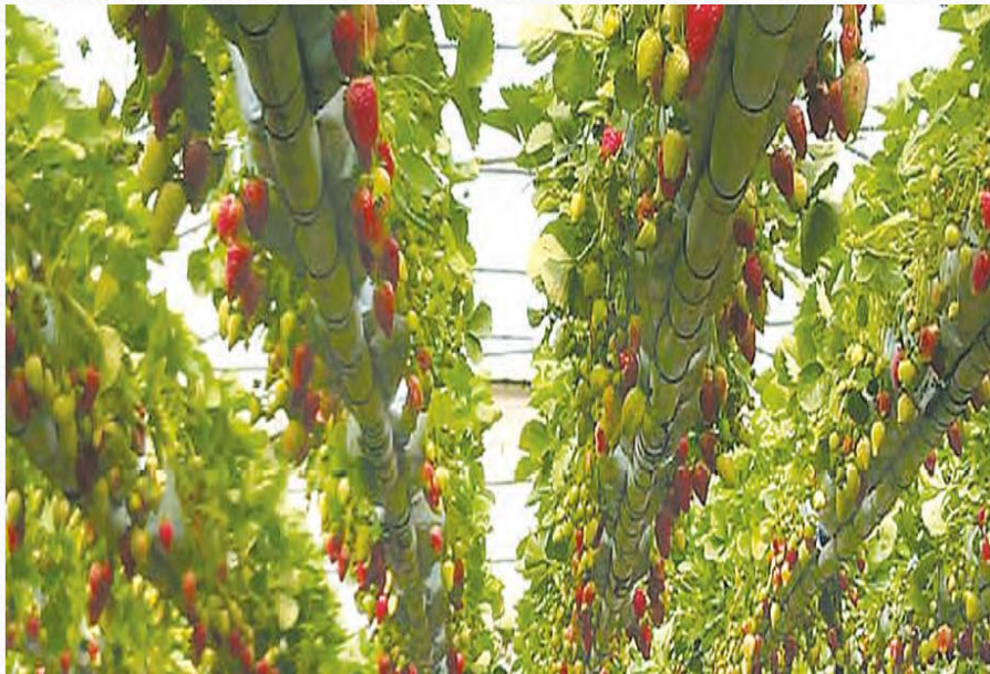
کشت گلخانه ای توت فرنگی هشتگرد البرز