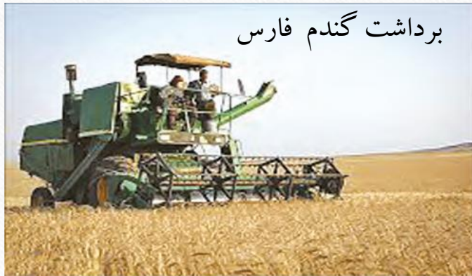
برداشت گندم فارس