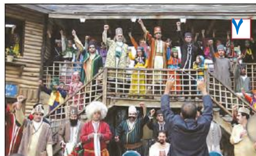
جشنواره اقوام ایرانی - تهران