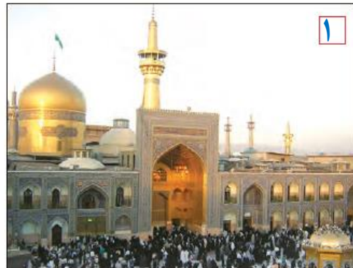
مشهد مقدس - خراسان رضوی