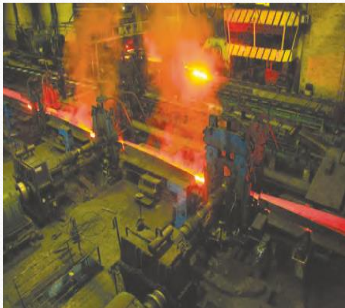
تولید فولاد اهواز

صنایع اصلی کشور را می توانیم به دو گروه « صنایع دستی » و « صنایع ماشینی » تقسیم بندی کنیم.