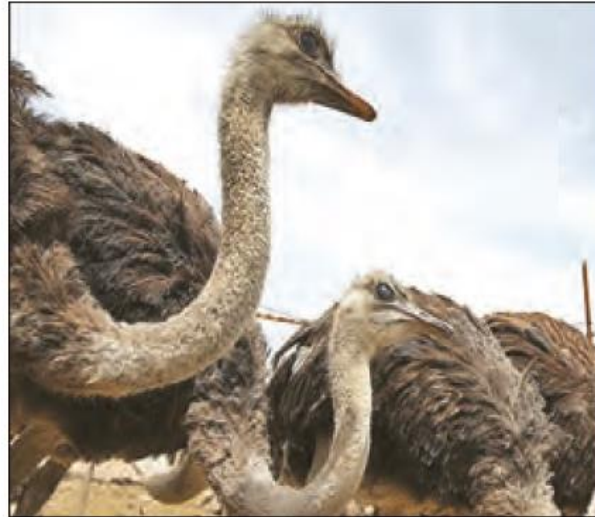
پرورش شترمرغ - ورامین