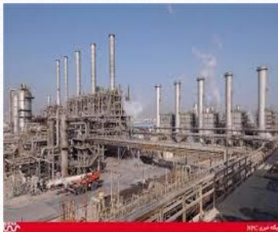
پتروشیمی بندر امام خمینی خوزستان