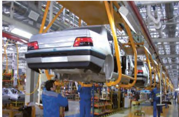
کارخانه ایران خودرو تهران

صنعت خودروسازی یکی از شاخصه های توسعه یافتگی کشور است که می تواند فرصت های شغلی بسیاری برای کشور فراهم آورد و از جمله صنایعی است که در سند چشم انداز به آن توجه خاصی شده است. دو شرکت بزرگ ایران خودرو و پارس خودرو (سایپا) ، بخش عمده ای از خودروهای کشور را تولید می کنند.