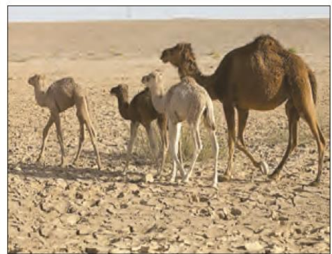
پرورش شتر - سیستان و بلوچستان