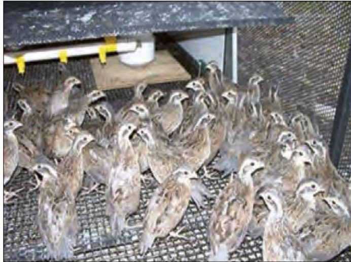
پرورش بلدرچین - گالیکش - گلستان