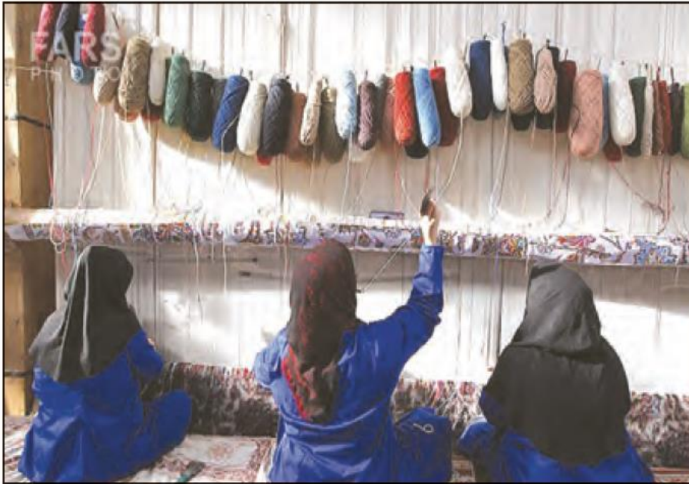
کارگاه بافت فرش دستی - استان کرمان