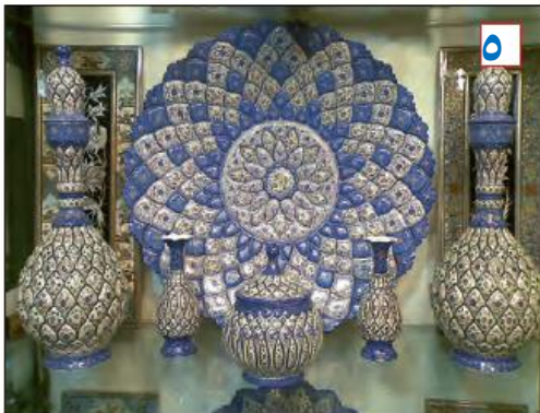
میناکاری - اصفهان