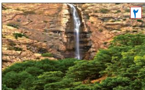
آبشار بهرام بیگی - استان کهگیلویه و بویراحمد