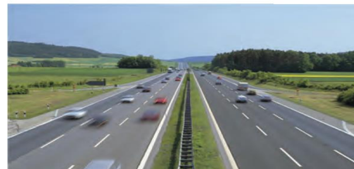
آزادراه قزوین - زنجان