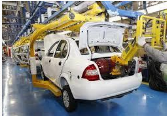
کارخانه پارس خودرو (سایپا) تهران