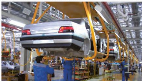
کارخانه ایران خودرو تهران