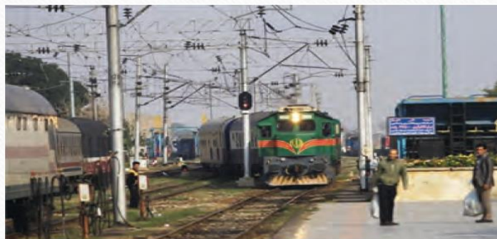
ایستگاه راه آهن ساری