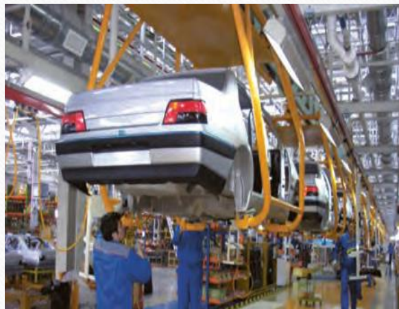
کارخانه ایران خودرو تهران