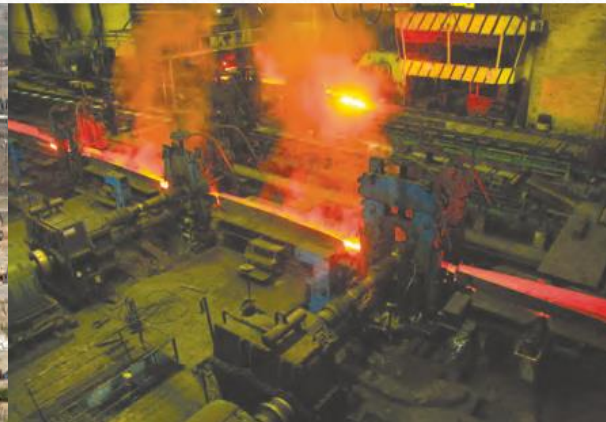
تولید فولاد اهواز