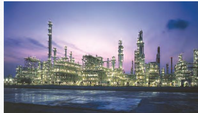
پتروشیمی شازند استان مرکزی