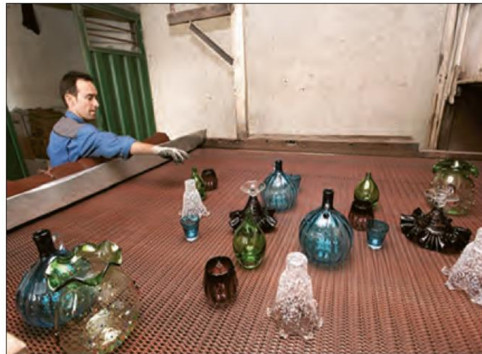
کارگاه شیشه گری - اسلام شهر - تهران