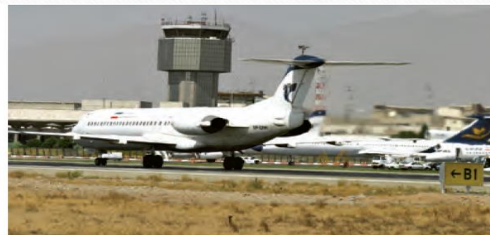
فرودگاه مهرآباد - تهران