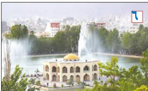
آلنگولی - تبریز - آذربایجان شرقی