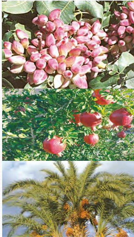
پسته رفسنجان کرمان انار ساوه مرکزی خرما آپیش بوشهر