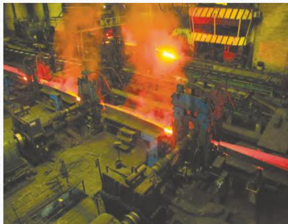
تولید فولاد اهواز