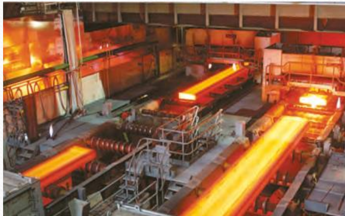
ذوب آهن اصفهان