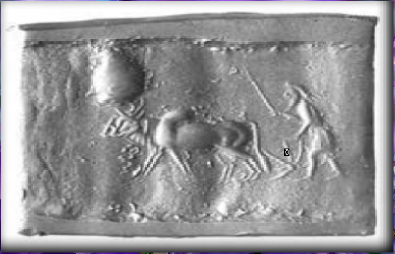
مهاری منگش به تصویر گاو آهن از دوره هخامنشی