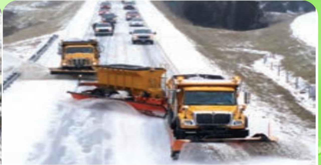
به کارگیری ماشین برف‌روب مجهز به جی‌پی‌اس جاده‌ای برای پاک‌سازی جاده‌ها - کانادا