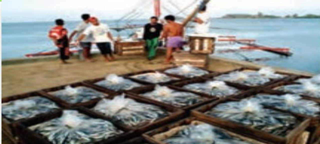
صيد ماهی - فیلیپین