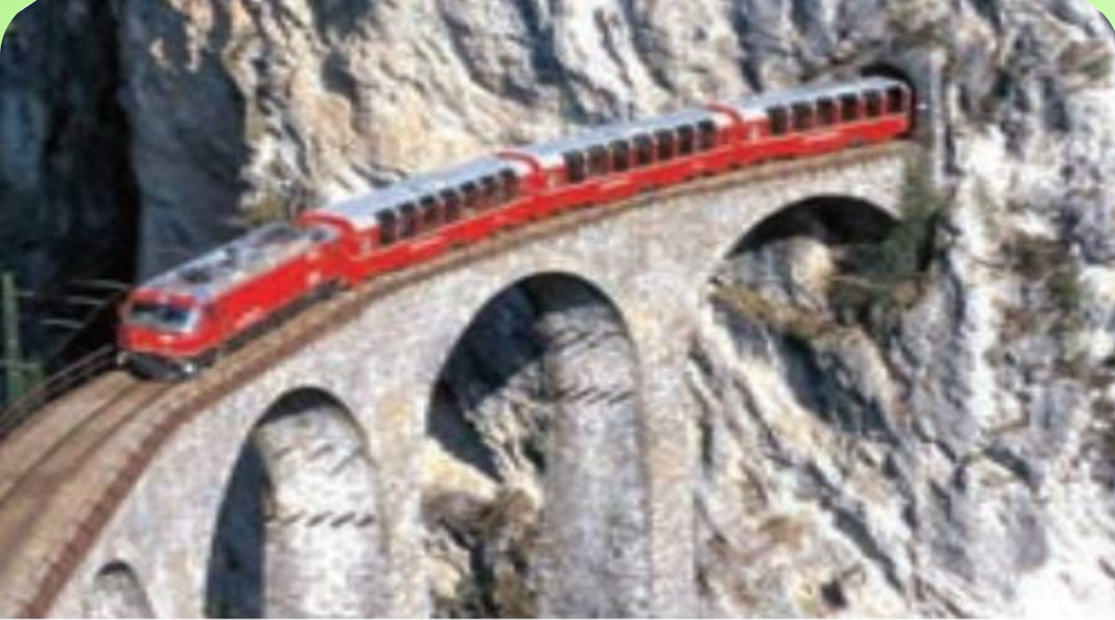
احداث تونل و پل برای عبور قطار در ناحیه‌ای کوهستانی و برف‌گیر - سوئیس