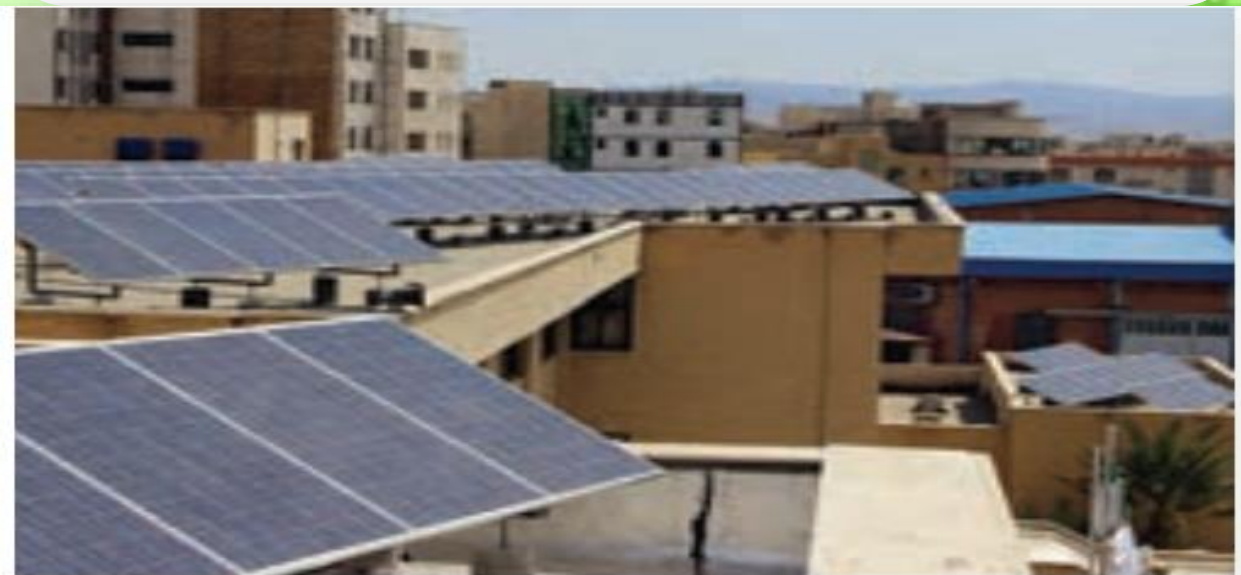
استفاده از صفحه‌های خورشیدی - اداره برق سمنان