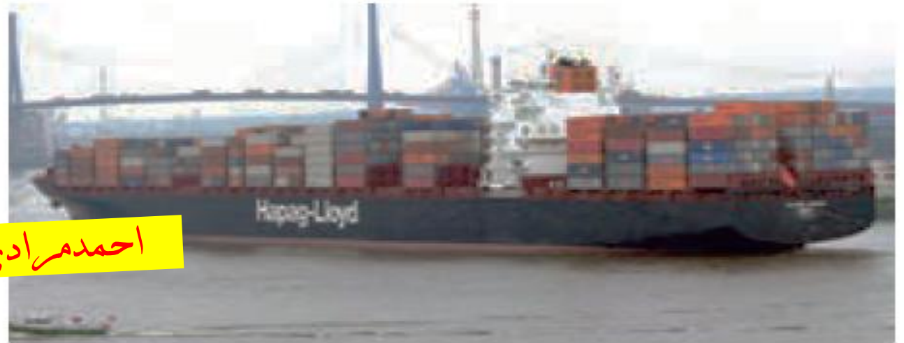
یک کشتی بزرگ کانتینری - آلمان