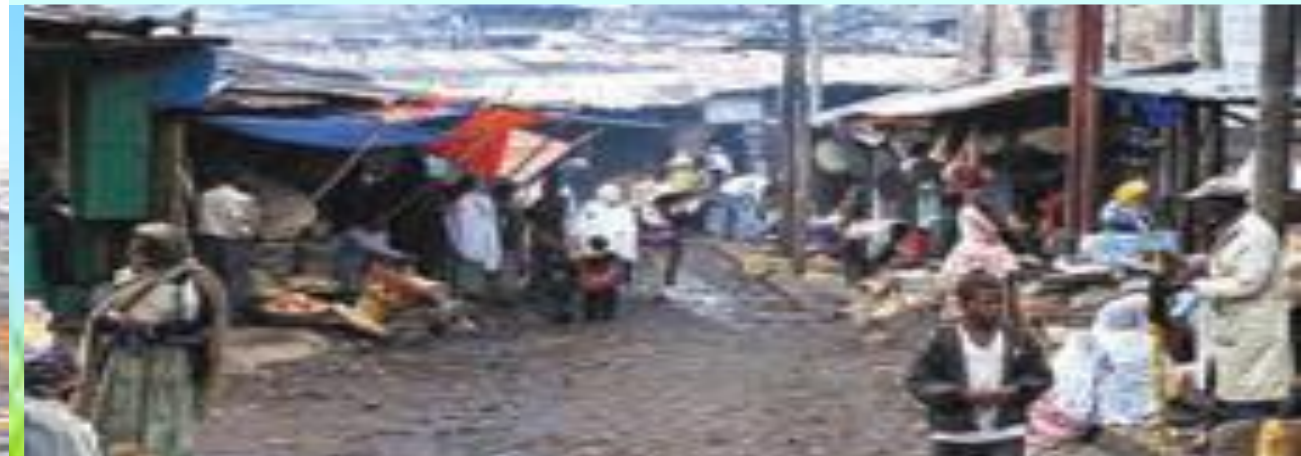
زاغه نشینی - اتیوپی