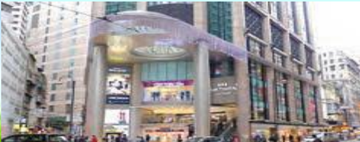
مرکز خرید لی تئاتر - هنگ کنگ

ناحیه هایی پدید می آیند که از نظر امکانات و تسهیلات و چشم اندازهای جغرافیایی با یکدیگر تفاوت دارند.